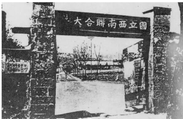
图 1-1 国立西南联合大学校门