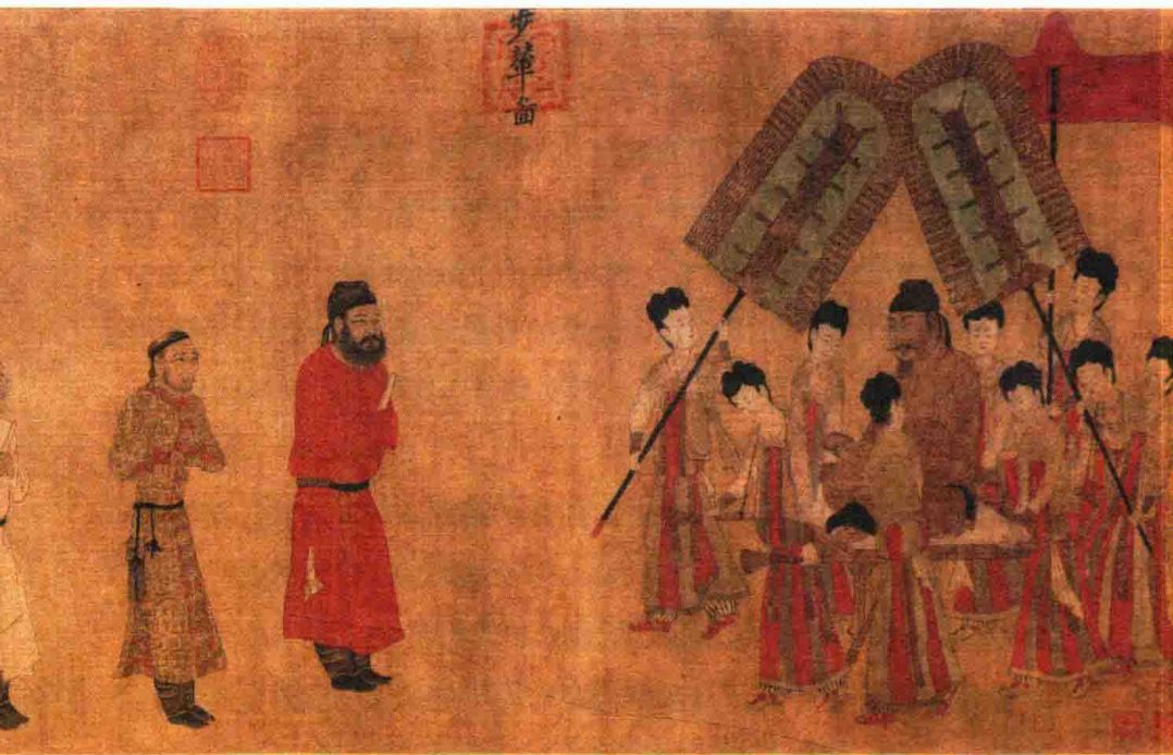
唐 阎立本 《步辇图》

称为软脚幞头，比如陕西省礼泉县韦贵妃墓壁画中的男性侍卫头上戴的就是。之后人们的审美观念转变了，给幞头的“脚”里加了骨架，把它撑起来，形成了硬脚幞头。从宋代到明代，硬脚幞头都是主流，还有干脆把幞头的双脚搞成上翘的。