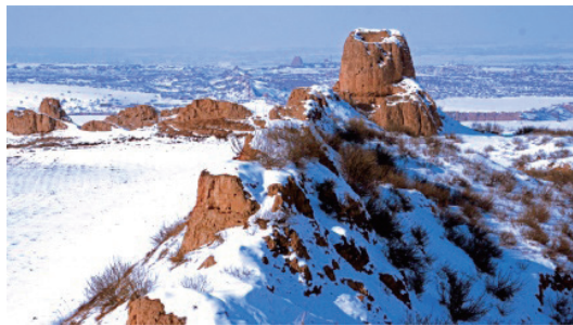
图 1-3 定边古长城遗址

古老的定边，是矗立边塞的古战场，黄河一级支流无定河，自白于山北麓生发源远。斯土此地，商周明月未照彻，秦汉雄风已吹渡。西望“长河落日圆”，北眺“大漠孤烟直”，临南遐思悠悠历史多少忠良报国“万里长征人未还”，面东遥想滚滚黄河滋养华夏文明“奔流到海不复回”。沧海桑田数千年，十余民族南来北往游牧狩猎商贸互市，时冷时热；朝代更替多少代，几多豪杰金戈铁马兵戎相见刀光剑影，有败有胜。