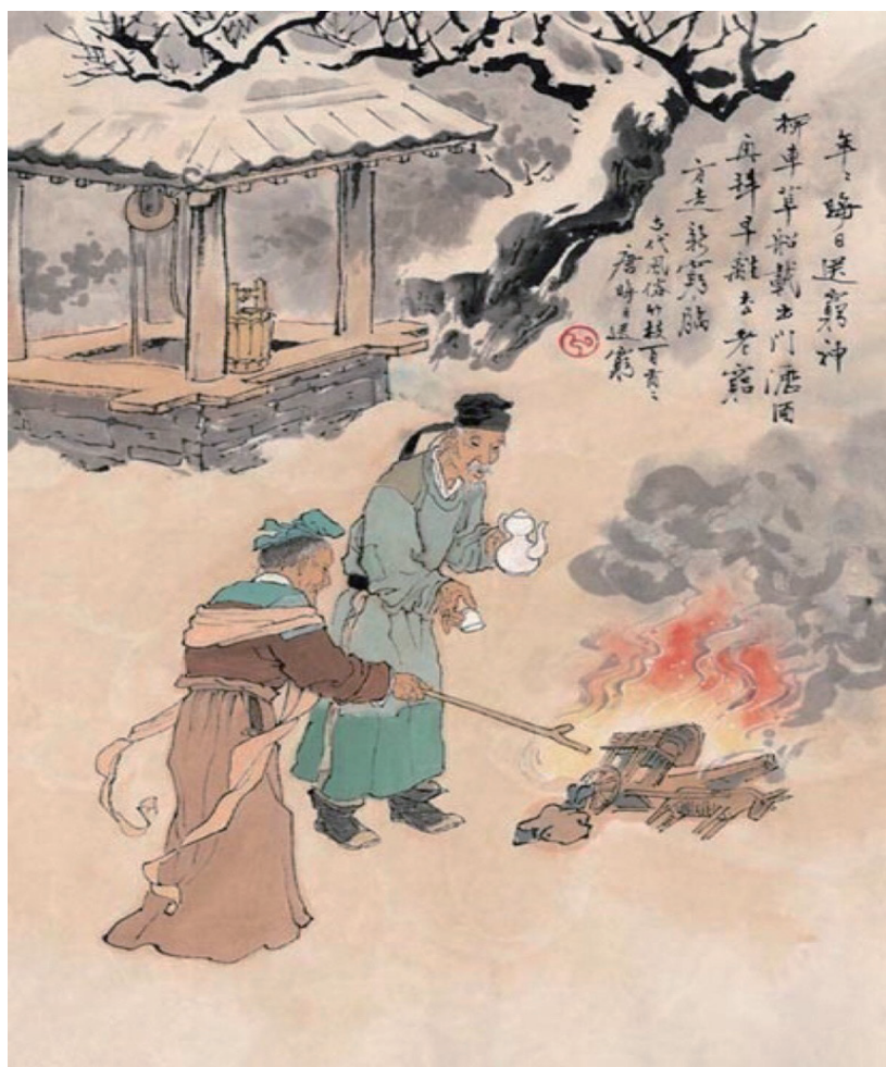
图序 -1 古代“送穷神”

困扰人类幸福最大的敌人就是“穷神”，中华民族的发展进程，就是与贫困顽强斗争的历史。中国人见面礼节性的问候是“你吃过了吗”？宴待客人之后还要问“你吃好了吗”？这种问候方式背后所承载的是历史上民族被饥饿所困而至今仍心怀忧惧。民以食为天，中国民众数千年的天，几乎被饥饿所笼罩。每年农历正月初四、初五，中国人有一个相传了数代的习俗，即“送穷神”，倒垃圾、剪纸人、焚香表、放鞭炮等年俗皆是为了祈祷“穷神”离家门。唐朝有首送穷诗曰：“年年晦日送穷神，柳车草马载出门。