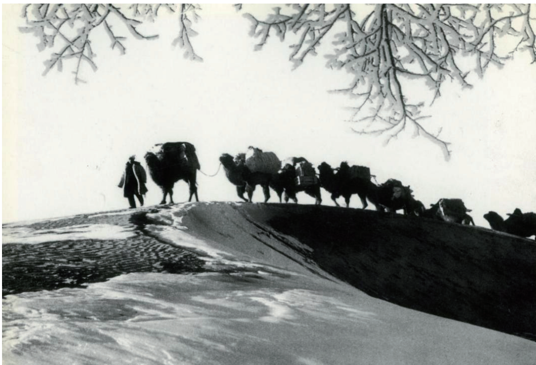
图 1-1 “盐马古道黄沙滚滚，驼铃声响不绝于耳”， 土地沙漠化程度严重，是致贫的“病根子”

定边县位于陕西省西北部，陕甘宁蒙四省（区）七县（旗）交界处，古有“东接榆延，西通甘凉，南邻环庆，北枕沙漠，土广边长，三秦要塞”之说，是陕西省的西北门户。县域面积 6920 平方公里，现总人口 35.21 万，辖 16 个镇、2 个乡，1 个街道办事处、1 个便民服务中心、185 个行政村（撤乡并镇后）。习近平总书记说：“反贫困是古今中外治国理政的一件大事。消除贫困、改善民生、逐步实现共同富裕，是社会主义的本质要求，是我们党的重要使命。”脱贫攻坚号角吹响以来，定边县委、县政府积极响应党中央号令和省市安排部署，在县委、县政府的带领下，全县 35 万干部群众发起了一场打好打赢脱贫攻坚的战役。