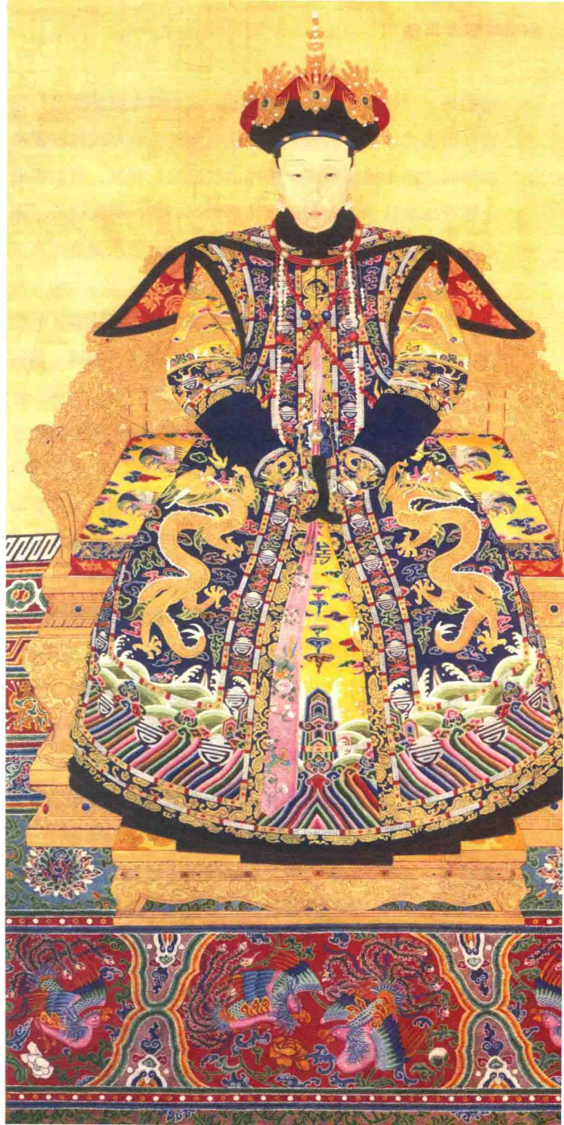
清 佚名 清高宗乾隆孝仪纯皇后朝服像