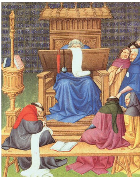
《圣经》阐述现场的抄写员 由荷兰著名微型画家林堡兄弟 (赫尔曼、保罗和约翰)创作 于1408年。