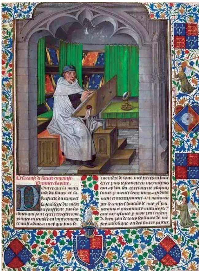
《历史之镜》插图之一