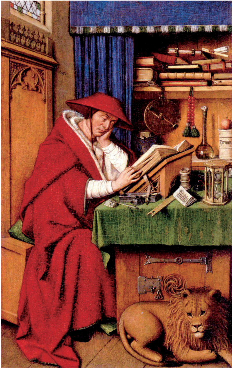
阅读中的圣哲罗姆