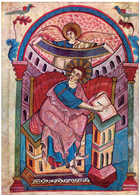
《阿达福音书》插图之一 出自8世纪末或9世纪初卡洛林王朝时期的一份手抄本。