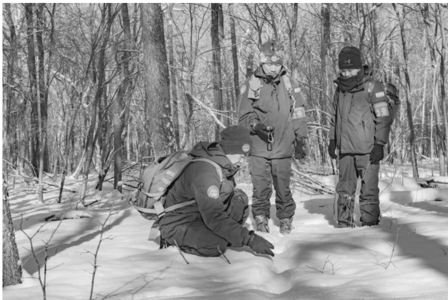
管护员巡护中观察和记录动物足迹

时间。野外行走，与野生动物别无两样，都在等待自然的风云变幻。漆黑的夜晚，围坐在一起，这便是他们奔走一天后的休息。