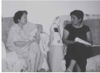
教育部第一任大学英语指导委员会主任，清华大学陆慈教授（左）