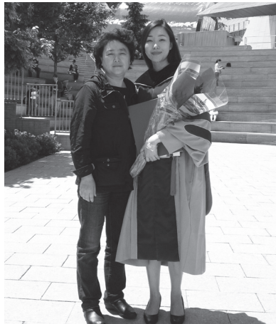
在 MIT 参加女儿博士毕业典礼与女儿合影