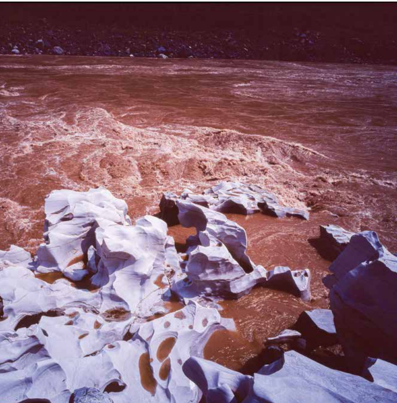
金沙江边的白石滩