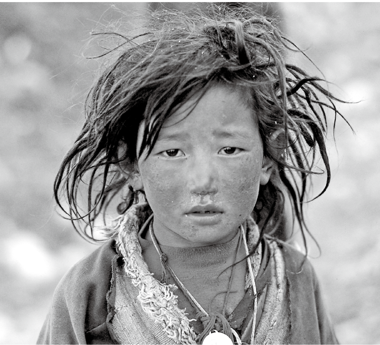
吉嘎老师让孩子们成为学生