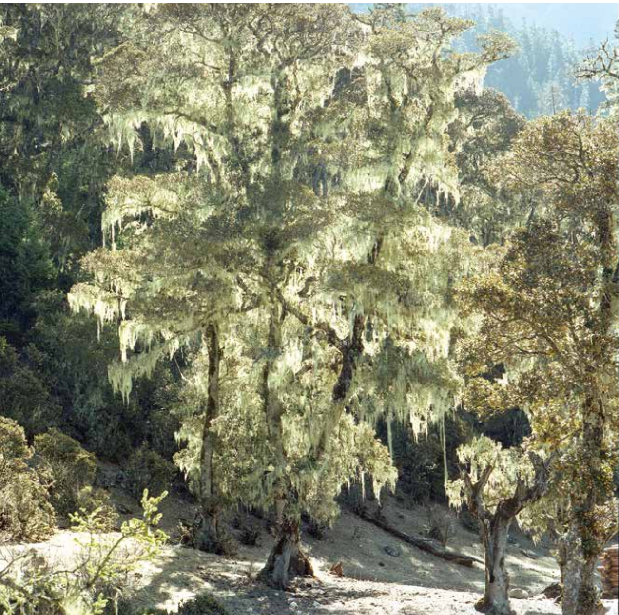
贡嘎山间的原始森林