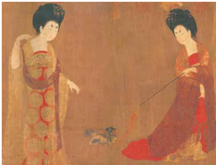
(唐) 周昉作品《簪花仕女图》