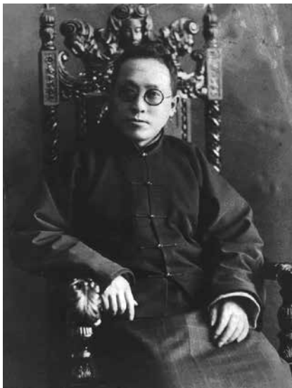
郑曼陀 ( 1888 ~ 1961 )