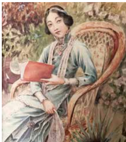
关蕙农绘月份牌作品