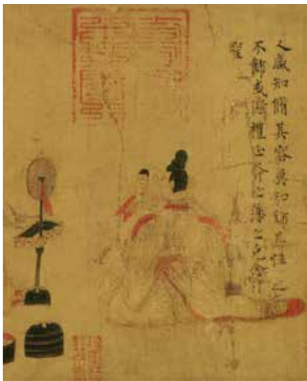
(东晋) 顾恺之作品《女史箴图》