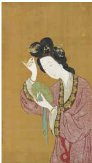
(宋)李公麟作品《仕女梳妆图》