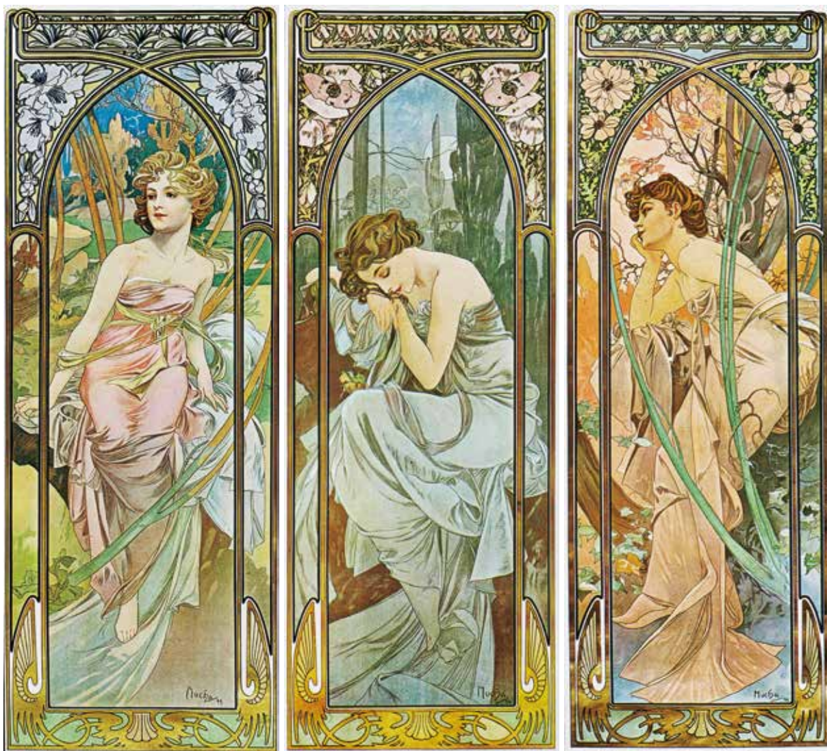
阿尔丰斯·穆夏作品

而唯美，多用柔美而充满律动感的曲线来进行画面的组织与构成，是新艺术运动的代表人物。他的作品通常以表现女性为主，人物的造型风格带有浓郁的古希腊雕塑的特点，脸庞端庄优雅而充满性感的气息，体态丰腴而纤长，多用衣裙褶皱和自然花卉来进行结构的表达和美化。画面的背景喜欢运用色彩明丽的自然风光与装饰图案纹样相结合，达到重叠交错而富有装饰性的目的，使画面中的女性犹如女神游历在仙境和人间。