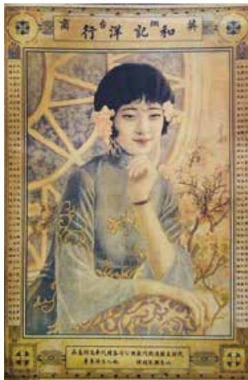
郑曼陀绘月份牌作品