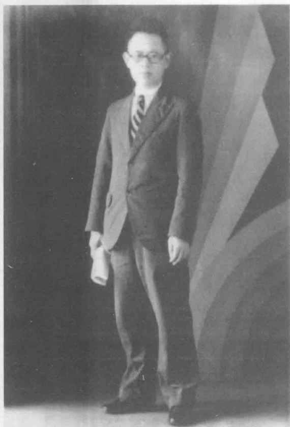
作者 1936 年留影, 时在河南大学经济系。