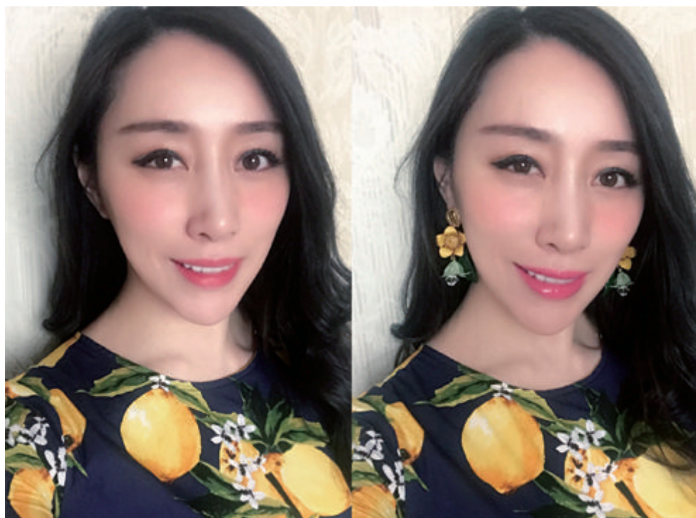
耳饰让人更添灵动之气

不同造型、材质和色彩的耳环，其修饰功能也不尽相同：或提升气场，或尽显柔美，或增强稚气，或蕴含优雅，或凝练知性。脸颊边的闪动和光彩，会让旁人眼前骤然一亮。耳饰的重要意义，让我想要和爱美的你、尊重自己的你、热爱生活的你一起分享，一起交流，一起活得更加精致美好。