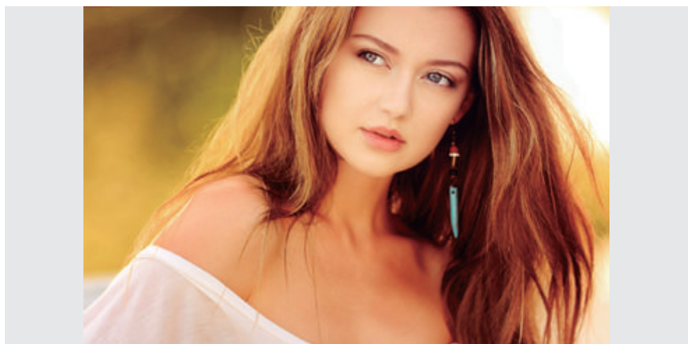
不同耳饰营造不同风格的美

人类在数万年前就通过制作饰品装饰自身，这是在意识层面超越动物的具体表现。当今物质极大丰富，为我们不断提升审美能力提供了极好的条件。众多饰物中，耳饰的装饰效果最佳、成本最低、变化最显著，我们甚至可以 365 天不重复地更换配饰，享受创造美感带来的无穷妙处，何乐而不为？