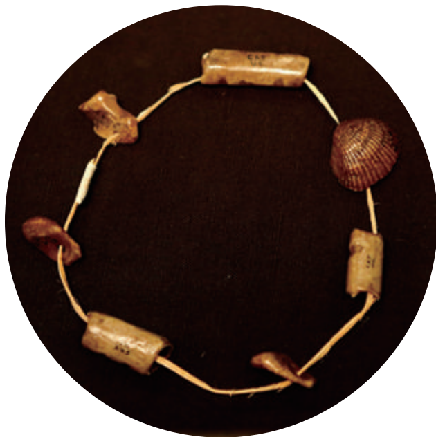
周口店遗址骨贝壳饰品

智人制作和佩戴饰品的历史至少可追溯到 10 万年前，而尼安德特人在 13 万年前就使用鹰爪制作出了人类最早的首饰 1 。这说明他们的抽象认知能力已达到一定水平，很可能具有符号思维能力和语言能力。在中国境内的山顶洞人考古遗迹中，发现了骨针和饰品 2 ，说明大概在 3 万年前，中国人的祖先就开始穿衣服和装饰自己了。但尚无证据表明他们佩戴耳饰，因为世界旧石器时代考古学中并未出现过耳饰 3 。