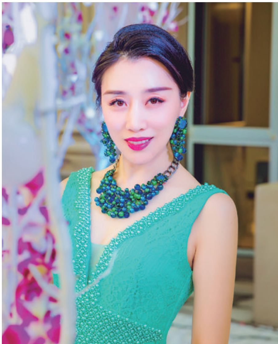
耳饰是呈现美的方式之一