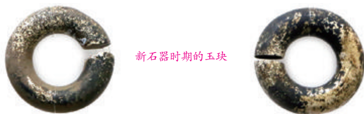
新石器时期的玉玦

很可能是人类历史上已知最古老的耳饰 1 。墓主人生前具有特殊的等级、地位和身份，是兼掌聚落神权、世俗权的巫兼聚落首领。由于当时的玉玦非常珍贵——青铜器出现之前，玉器的制作也需要投入相当多的时间和精力，不是人人都可以拥有的——因而并非世俗性的装饰品，而是事神的玉器。巫在事神时必须将其佩戴在耳部，方能进入具有事神气氛和状态的祭祀程序。死后亦佩戴在耳部 2 。