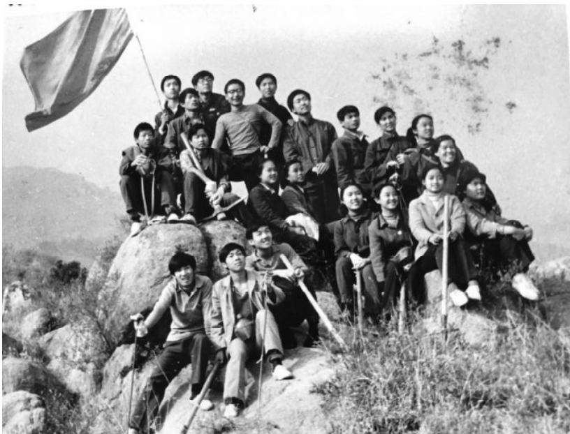
1982年10月，作者（前排左3）和所在的北京外贸学院海关系82级2班同学在北京西山参加新生植树义务劳动