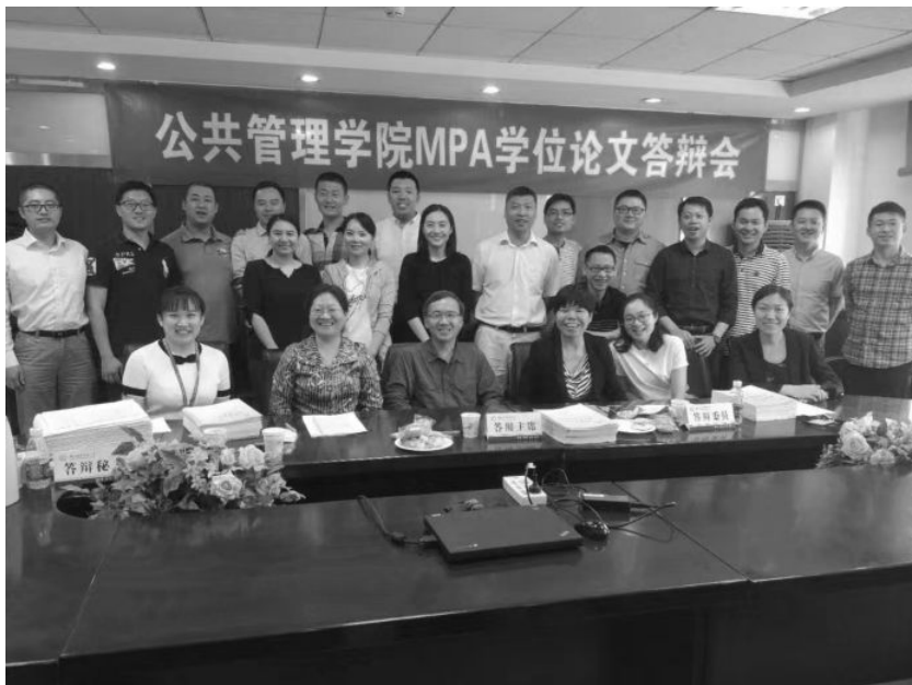
2017年5月，作者（前排左3）作为答辩主席与参加对外经济贸易大学MPA硕士研究生论文答辩学员合影