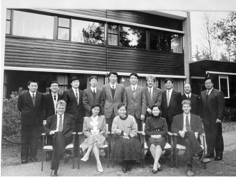
1991年10—12月，作者（后排左2）参加在荷兰举办的“海关监管与教学法培训班”期间的合影