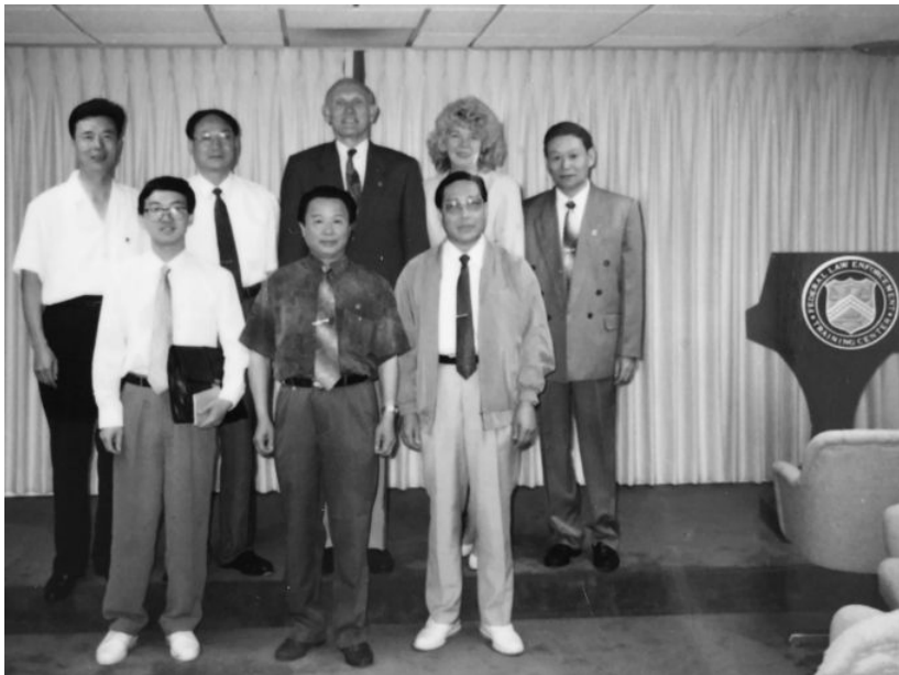
1995年6月，作者（前排左1）作为中国海关教育代表团成员兼翻译在美国联邦执法培训学院（乔治亚）的合影