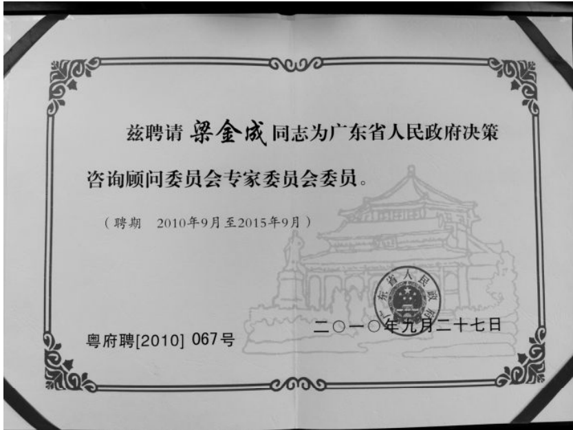
2010年9月，广东省人民政府聘请作者为“广东省人民政府顾问咨询委员会专家委员”证书