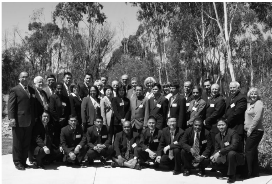
2007年10—11月作者（前排右3）参加在澳大利亚堪培拉大学举办的“海关高级管理培训班”期间与老师和同学合影