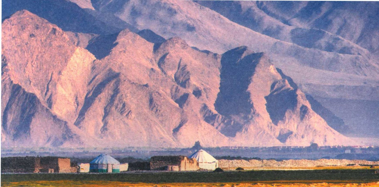
■ 帕米尔高原 パミール高原