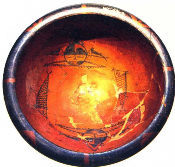
■ 原始社会・人面鱼纹彩陶盆 原始社会・人面魚紋彩陶盆

中国は、世界四大文明の一つであり、約 5,000 年の文明史を持つ。史上初の王朝・夏（紀元前 2070 年頃—紀元前 1600 年頃）は 4,100 年前のことである。中国社会の発展は原始社会、奴隶社会、封建社会、半植民地半封建社会などといった歴史段階を経て、1949 年 10 月 1 日、中華人民共和国が成立された。