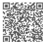
“努力的 lorre 视频”扫码观看

动漫区的“努力的 lorre”作为一名专注于讲述美漫（美国漫画）的短视频创作者，运用风趣幽默的言语将“漫威”和“DC”等美漫大厂的发展历史和旗下作品的相关内容普及给观众。