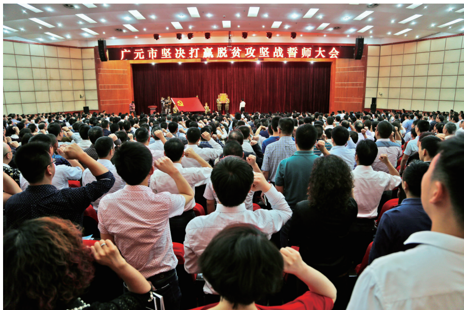
广元市坚决打赢脱贫攻坚战誓师大会

有序推进村党组织合建联建、抱团发展。广元市以农村党支部合建共建为切入点，合并新建 906 个村党支部，占行政村总数的 37.4%。四是促进党建引领经济发展，打造党建发展力。积极探索党建引领山区集体经济发展“643”模式，选育 2843 户党员中心户，采取党员中心户与骨干党员共同联系 10~20 名党员群众的模式，辐射带动 5.5 万余名群众致富奔小康。五是推动党建助力社会建设，培育实践创新力。完善村党组织领导村级治理体制机制，强化村党组织领导核心地位，构建常态教育思想激励、树立典型精神激励、道德积分物质激励、村规民约制度激励“四位一体”机制，多措并举激发贫困群众脱贫奔康的内生动力。近年来，累计培训新型农民 16.3 万人次。