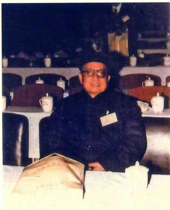
郭霭春教授参加中日《内经》学术交流会 (摄于1985年)