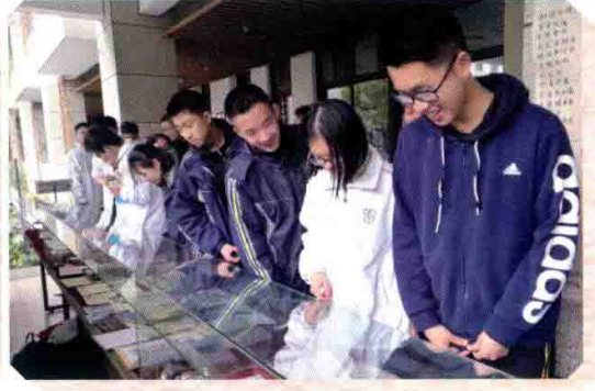
在学军中学西溪校区的“新中国·老物件”展览现场，同学们兴致勃勃地驻足观看、交流讨论。