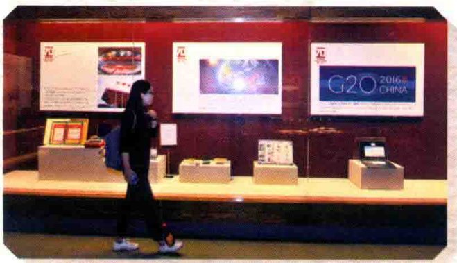
“我眼中的70年——学军中学学生家藏老物件展”现场。