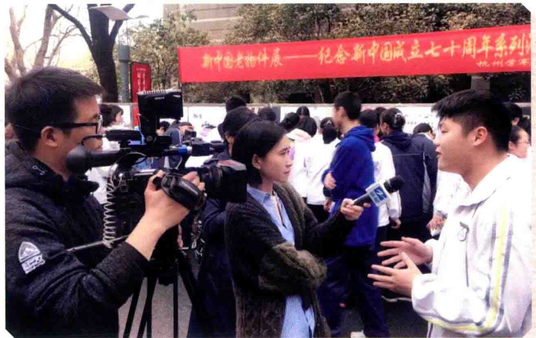
媒体采访正在观展的学军中学同学。