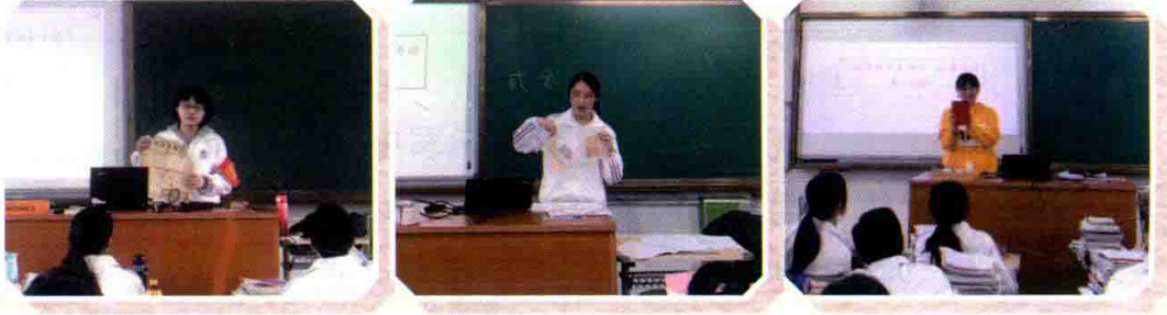
学军中学的同学在班级展评会中介绍家藏老物件。