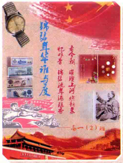
2017级、2018级共有13个班级参加展评活动。同学们亲手设计了宣传海报，展示了本班同学家庭的代表性老物件。