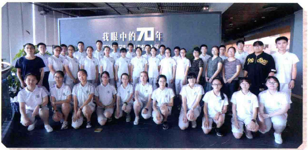
2019年7月17日,学军中学历史教研组的老师与同学们一同参与撤展工作。