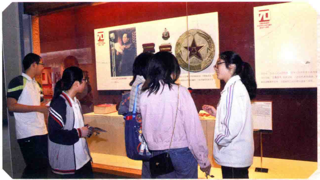
来自学军中学的学生志愿者向观众介绍展品。