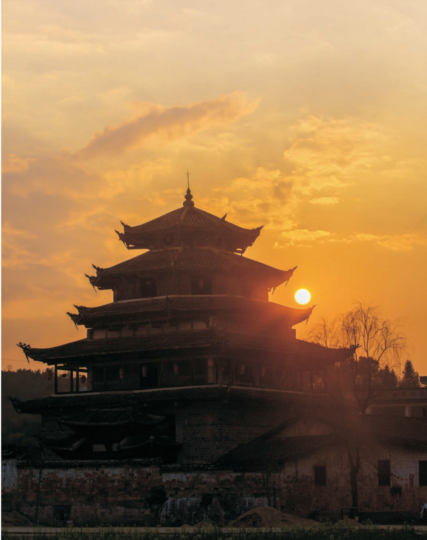
◎ 宝阁睇霞 \ 王绮芸 摄