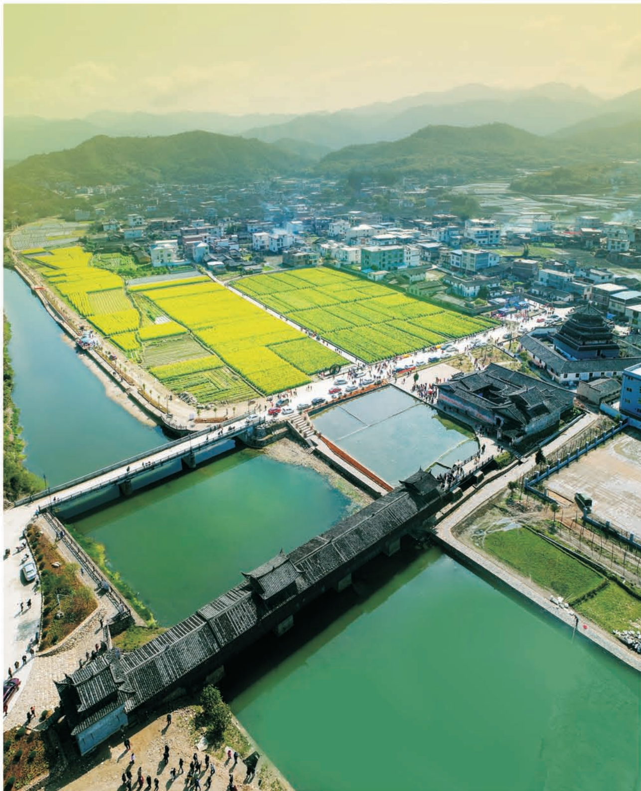
◎ 双桥卧波