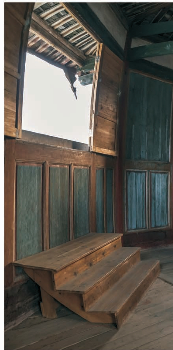
◎ 奎壁联辉（文昌阁一楼大殿）