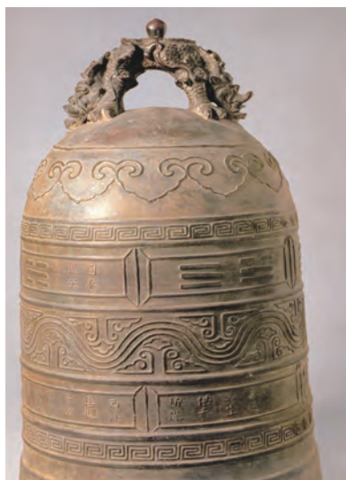
长乐出土的郑和铜钟