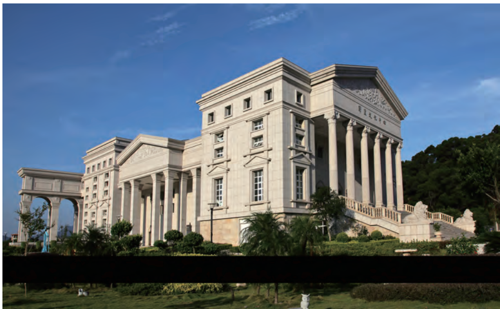
长乐潭头镇泽里村村民和侨民共同兴建的文化中心

长乐人民性舒而志强，外柔而内坚，适应性和参与性强。既敢于把创业平台搭向海内外，主动登台，抢摊拼搏，也善于把认他乡作故乡，和寓居地或客居国人民友好相处；努力为世界和平与发展、为居留地进步与繁荣、为中华统一振兴和家乡长乐的文明进步，不断打造了自己的形象和价值。