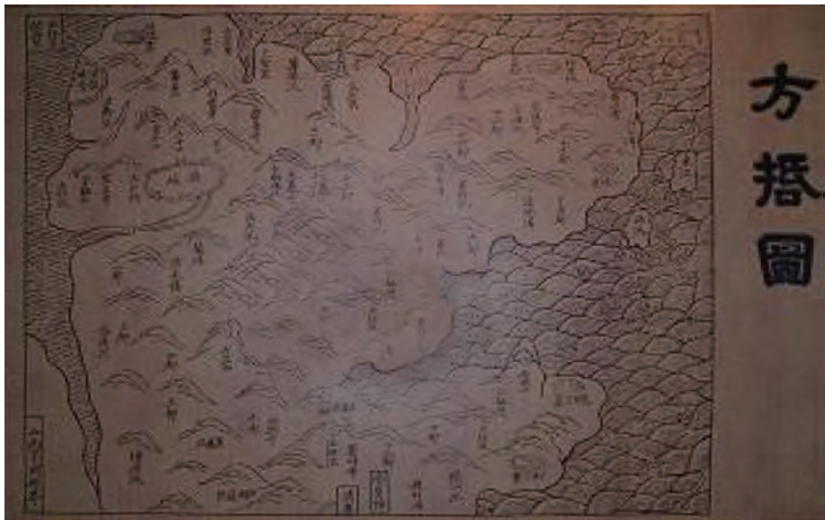
明弘治县志《方域图》

清顺治二年（1645年），明唐王朱聿键即位福州，改元隆武。长乐在其辖下。后隶属福建承宣布政使司。康熙元年（1662年）清廷为镇压东南沿海郑成功的反清势力，令濒海居民内迁。光绪十年（1884年）闰五月，法舰侵入台湾海峡，入闽江；七月初三，炮毁福建水师。三江口水师旗营、南北岸各炮台、闽江两岸军民英勇反击。初九，法舰撤出闽江口。