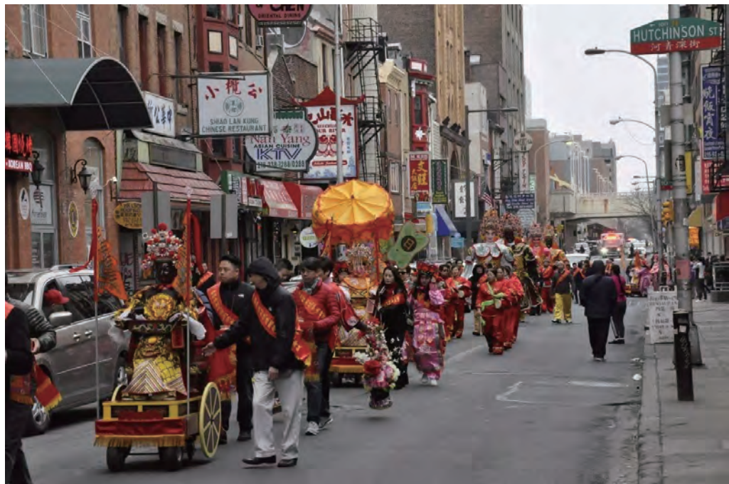
在美国费城举行的猴屿民俗文化节

新的时代、新的世纪，正赋予滨海长乐更加开放、更加开明、更加开拓、更加开朗的精神风貌。长乐儿女正以自身的聪明才智和创造底蕴，浓墨重彩描绘21世纪的发展蓝图。一个文明、昌盛、美丽、富饶的新长乐，将由长乐各姓人民的巨手托起在闽江口岸！