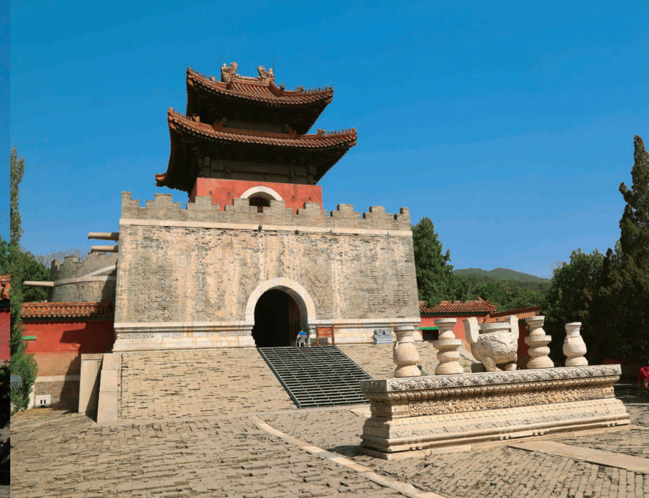
慈禧陵石五供及方城明楼

慈禧陵的石五供由须弥座形的祭台和一个香炉、二个花瓶、二个烛台组成。祭台的上枋雕刻缠枝莲花，上下枋雕刻仰伏莲花瓣，下枋雕刻八宝、暗八仙和各种吉祥图案，如事事如意、琴棋书画等。香炉上的炉顶、花瓶上插的灵芝、烛台上的蜡烛和火焰都是用名贵的紫砂石雕刻的，可惜未能保留下来。明楼建在方城之上，重檐歇山顶，南面两檐之间曾挂斗匾一方，文字是“普陀峪定东陵”，满文居中，蒙古文在左（东），汉字在右（西）。清陵明楼带券脸石始自定陵。洁白弧形的券脸石镶嵌在朱红的檐墙上，红白分明，使得明楼格外秀美。