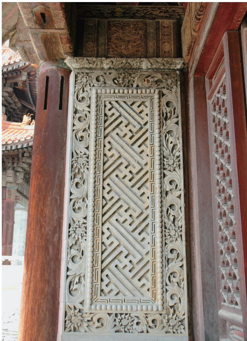
慈禧陵东配殿廊心墙砖雕

慈禧陵东西配殿前廊两端的廊谊墙中心雕刻卍不到头图案，边框分别环以回纹、掐珠子、缠枝宝相花，全部筛扫红黄金，非常精美，其雕刻技艺和寓意与殿内雕砖图案保持了一致。配图为东配殿北廊心墙，金粉已被歹人刮掉。