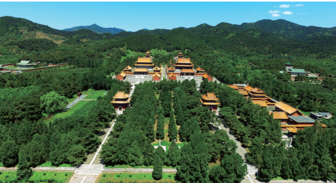
定东陵鸟瞰（慈安陵右、慈禧陵左）