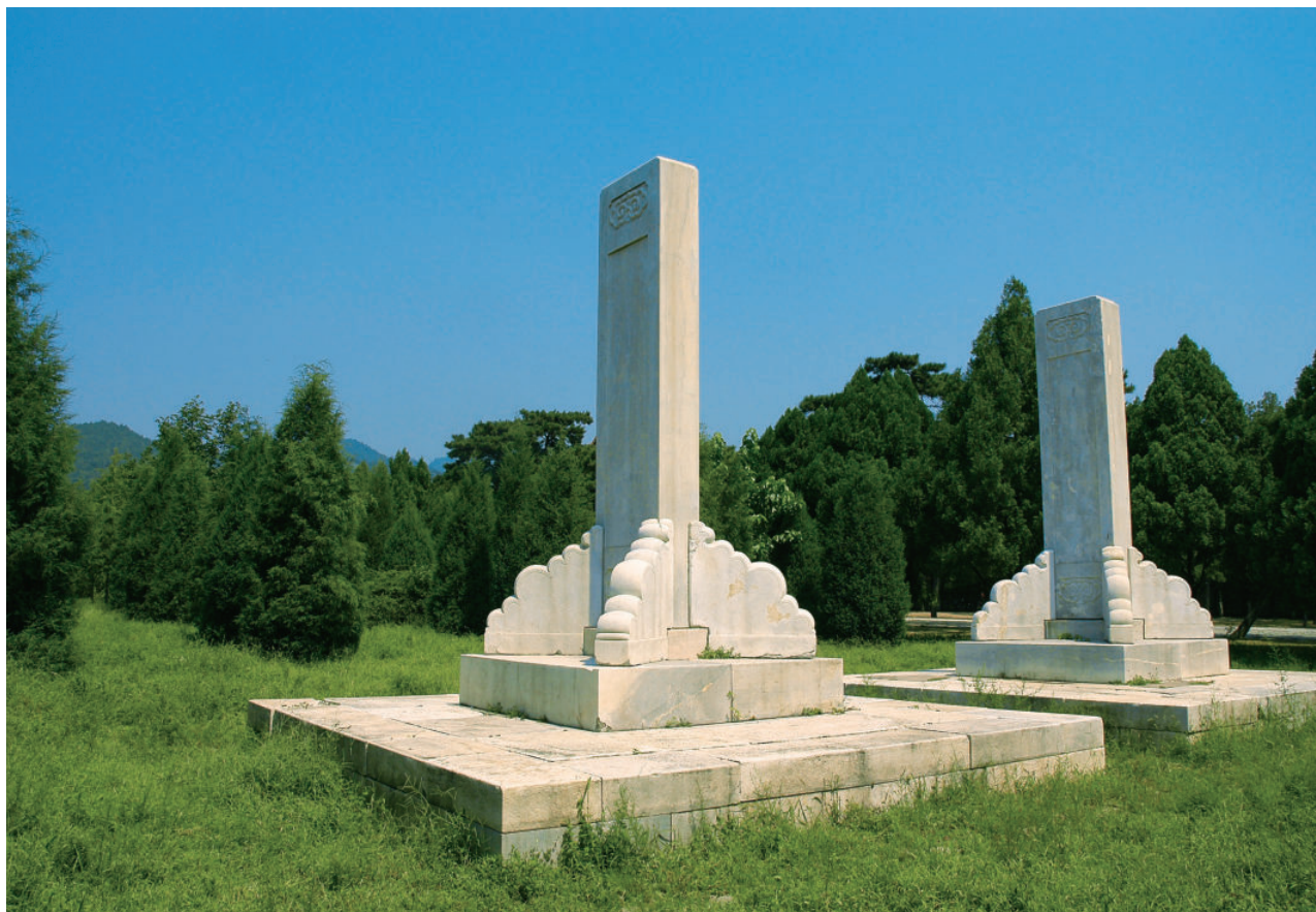
图中左（高）为慈安陵东下马牌，右（低）为慈禧陵的西下马牌

因为两座定东陵——慈安陵和慈禧陵并排建立，所以这两陵的四座下马牌处于一条直线上，成为清陵中的一道风景。