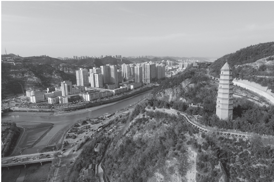
2021年4月22日拍摄的延安市宝塔山（无人机照片）。