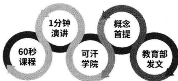
图 1-1 微课起源的五种观点