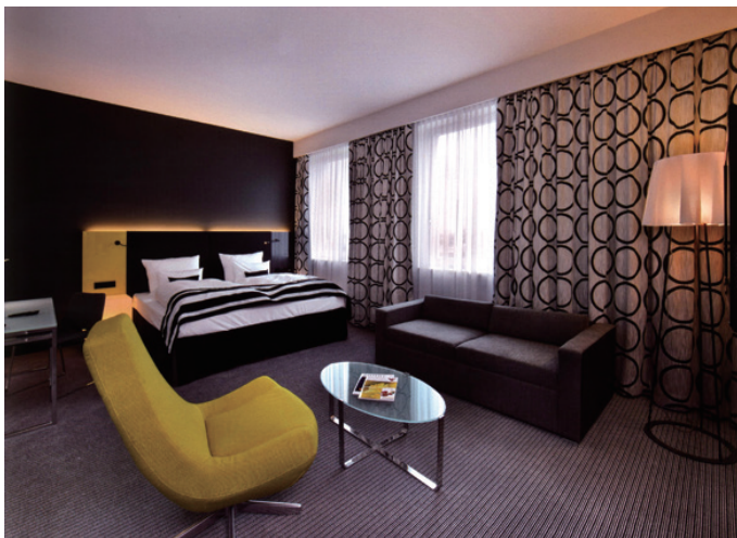
图1-12 家用纺织品图案