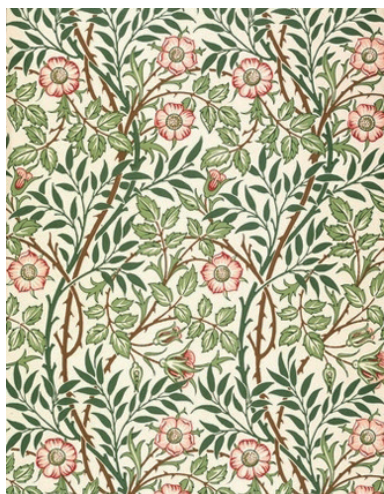
图1-6 西式具象花叶图案