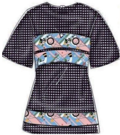
图1-17 图案的局部强调效果