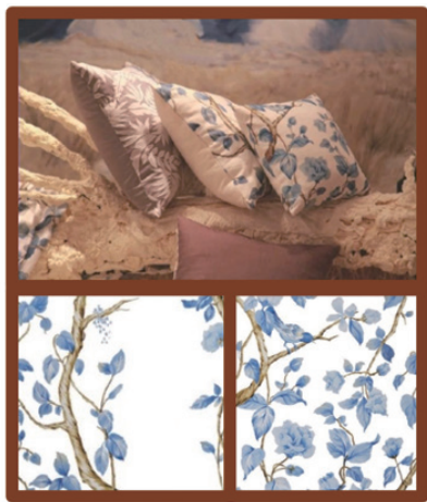
图1-16 图案在纺织品中的修饰作用

通常，纺织品图案对纺织品能够起到修饰、点缀的作用，使原本在视觉形式上显得单调的纺织品产生层次、格局和色彩的变化，以达到纺织品整体和谐之美的目的（图1-16）。除此之外，纺织品图案还可起到加强与突出织物局部视觉效果的作用，形成一定的视觉张力（图1-17）。