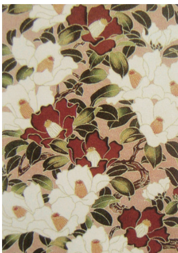
图1-5 中式具象花叶图案

具象指具体的形象，是人们在生活中多次接触、多次感受的，既丰富多彩又高度凝缩了的形象。它不仅是感知、记忆的结果，而且是有情感烙印的思维加工。具象图案是指有具体形象的图案，其概念也是相对抽象图案而形成的，是图案的一种表现手法，也可以看作是图案的一种艺术风格。具象图案是纺织品图案中较为常见的艺术样式，内容可谓是包罗万象，表现手法也极为丰富（图1-5、图1-6）。