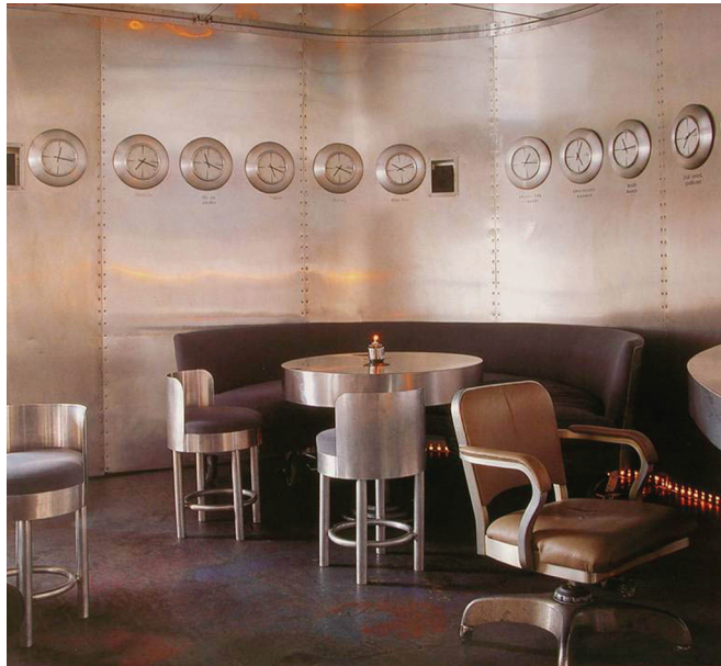
图 1-9 光亮派