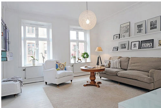
图 1-10 白色派室内空间