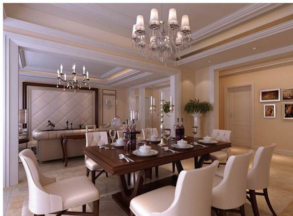
图 1-11 新洛可可派餐厅