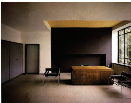
图 1-3 包豪斯校舍

“后现代主义”一词最早出现在西班牙作家德·奥尼斯 1934 年的《西班牙与西班牙语类诗选》一书中,用来描述现代主义内部发生的逆动,特别有一种现代主义纯理性的逆反心理,即为后现代风格。20 世纪 50 年代,美国在所谓现代主义衰落的情况下,也逐渐形成后现代主义的文化思潮。受 20 世纪 60 年代兴起的大众艺术的影响,后现代风格是对现代风格中纯理性主义倾向的批判。后现代风格强调建筑及室内装潢应具有历史的延续性,但又不拘泥于传统的逻辑思维方式,探索创新造型手法,讲究人情味,常在室内设置夸张、变形的柱式和断裂的拱券,或者把古典构件的抽象形式以新的手法组合在一起,即采用非传统的混合、叠加、错位、裂变等手法和象征、隐喻等手段,创造一种融感性与理性、集传统与现代、糅大众与行家于一体的“亦此亦彼”的建筑形象与室内环境。对后现代风格不能仅仅以所看到的视觉形象来评价,需要我们透过形象从设计思想来分析。后现代风格的代表人物有 P. 约翰逊、R. 文丘里、M. 格雷夫斯等。(见图 1-4)