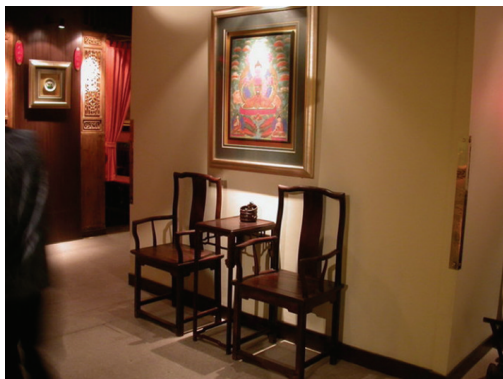
图 1-1 中式传统风格