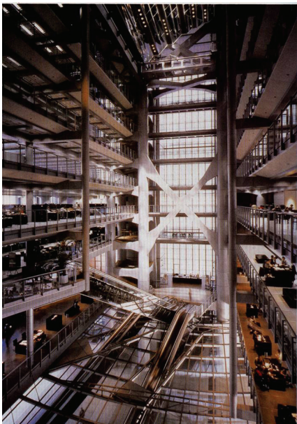
图 1-8 香港汇丰银行内景

光亮派也称银色派,室内设计中夸耀新型材料及现代加工工艺的精密细致及光亮效果,往往在室内大量采用镜面及平曲面玻璃、不锈钢、磨光的花岗石和大理石等作为装饰面材,在室内环境的照明方面,常使用反射、折射等各类新型光源和灯具,在金属和镜面材料的烘托下,形成光彩照人、绚丽夺目的室内环境。(见图 1-9)