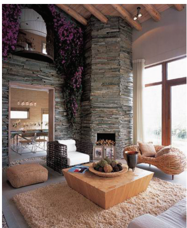
图 1-5 运用木、石自然元素的起居室

自然风格倡导“回归自然”,美学上推崇“自然美”,认为只有崇尚自然、结合自然,人们才能在当今高科技、高节奏的社会生活中,取得生理和心理的平衡,因此室内多用木料、织物、石材等天然材料,显示材料的纹理,清新淡雅。此外,由于自然风格与田园风格的宗旨和手法类同,故可把田园风格归入自然风格一类。田园风格在室内环境中力求表现悠闲、舒畅、自然的田园生活情趣,也常运用天然木、石、藤、竹等材质质朴的纹理,巧于设置室内绿化,创造自然、简朴、高雅的氛围。(见图 1-5、图 1-6)