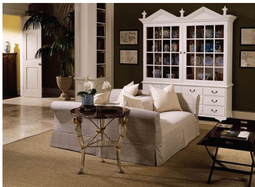
图 1-2 简欧风格