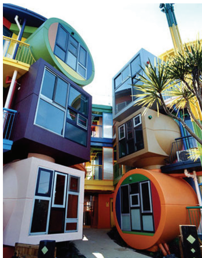
图 1-12 风格派

超现实派追求所谓超越现实的艺术效果,在室内布置中常采用异常的空间组织、曲面或具有流动弧线形的界面,浓重的色彩,变幻莫测的光影,造型奇特的家具与设备,有时还以现代绘画或雕塑来烘托超现实的室内环境气氛。超现实派的室内环境较为适宜具有视觉形象特殊要求的某些展示或娱乐的室内空间。(见图 1-13)