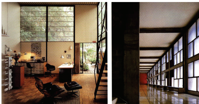
图 1-4 美国加利福尼亚艾米斯住宅内景