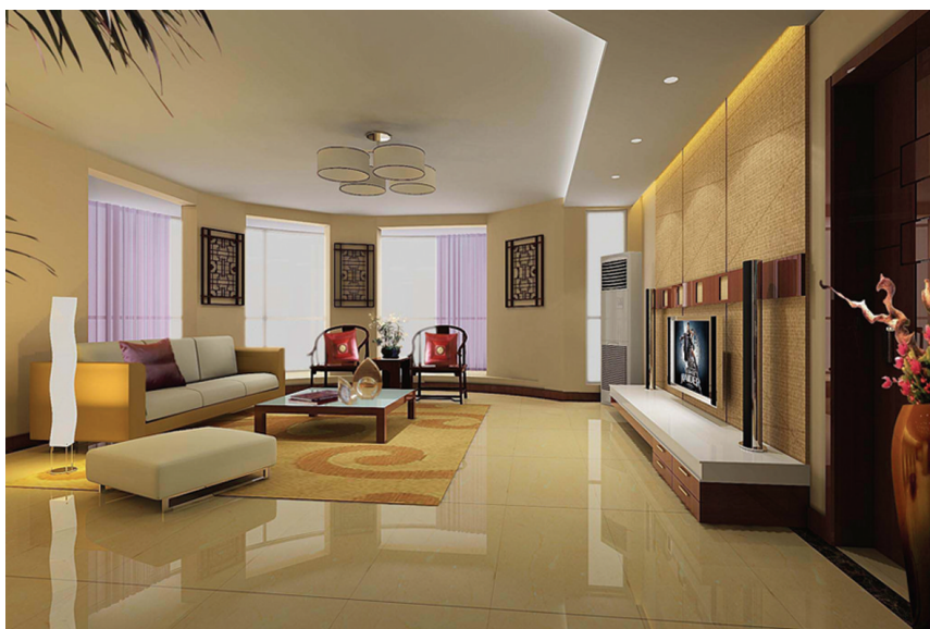
图 1-7 带有中式元素的起居室

近年来,建筑设计和室内设计在总体上呈现多元化、兼容并蓄的状况。室内布置既趋于现代实用,又吸取传统的特征,在装潢与陈设中融古今中外于一体,例如,传统的屏风、摆设和茶几,配以现代风格的墙面及门窗装修、新型的沙发;欧式古典的琉璃灯具和壁面装饰,配以东方传统的家具和埃及的陈设、小品等。混合型风格虽然在设计中不拘一格,运用多种体例,但设计中仍然匠心独具,深入推敲形体、色彩、材质等方面的总体构图和视觉效果。(见图 1-7)