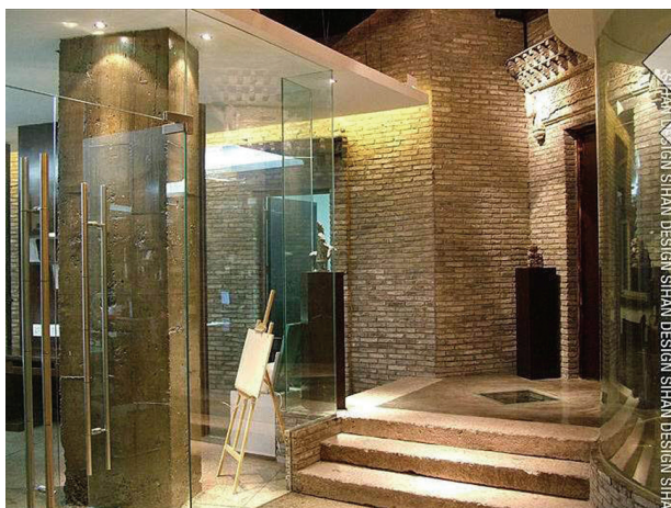
图 1-6 运用青砖和仿古建筑造型的空间