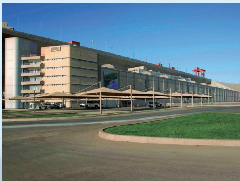
苏丹麦洛维水电站装饰装修工程，由电建建筑公司承建