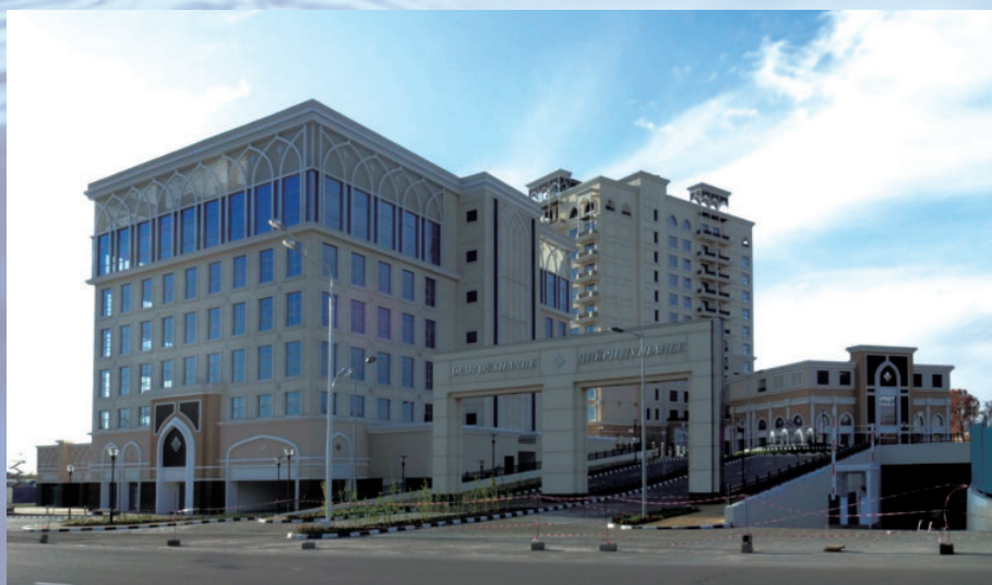
塔吉克斯坦杜尚别房建一期项目，由电建建筑公司承建