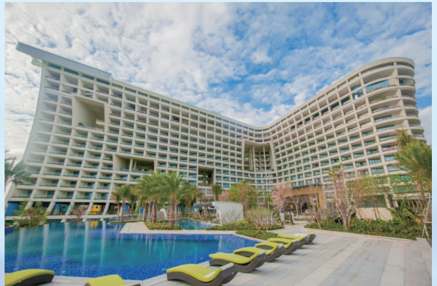
海南省三亚市康年酒店项目，由电建建筑公司承建，2017年获海南省建筑施工优质结构工程奖，2018年获国家优质工程奖