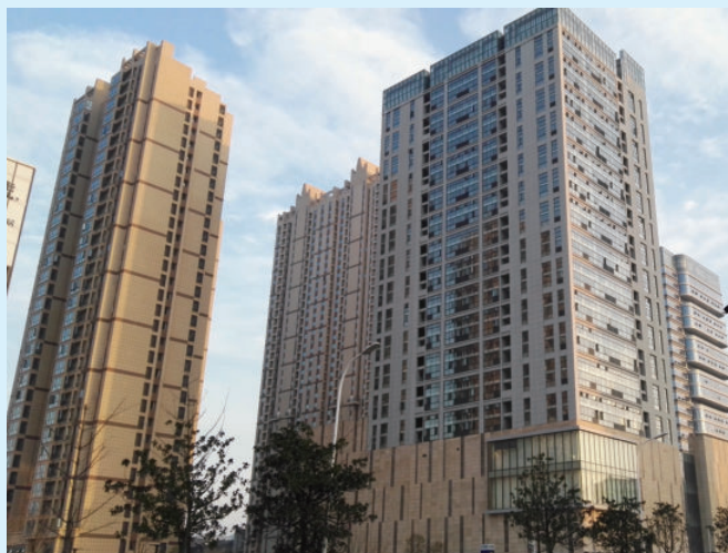
湖北省襄阳市南国项目，由电建建筑公司承建，2017年获湖北省建设优质工程奖（楚天杯）