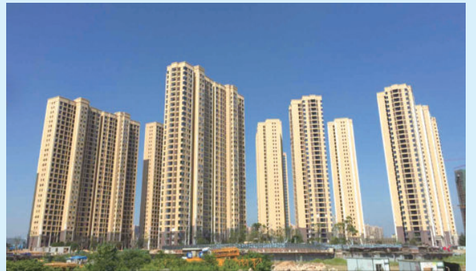
湖南省长沙市湘熙水郡住宅项目，由电建建筑公司承建