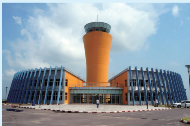
刚果（金）恩吉利机场塔台项目，由电建建筑公司承建