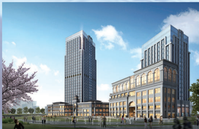
湖北省武汉市南国县华林项目，由电建建筑公司承建