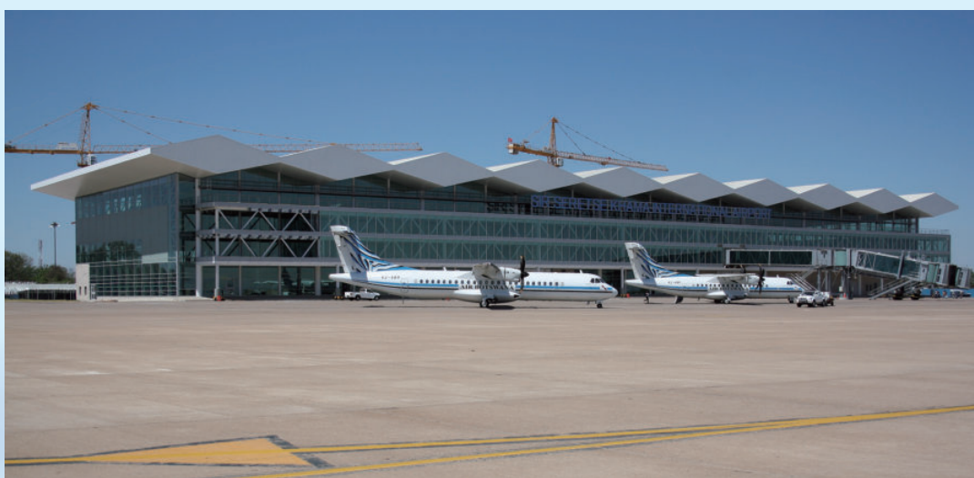
博茨瓦纳卡玛国际机场航站楼，由电建建筑公司承建