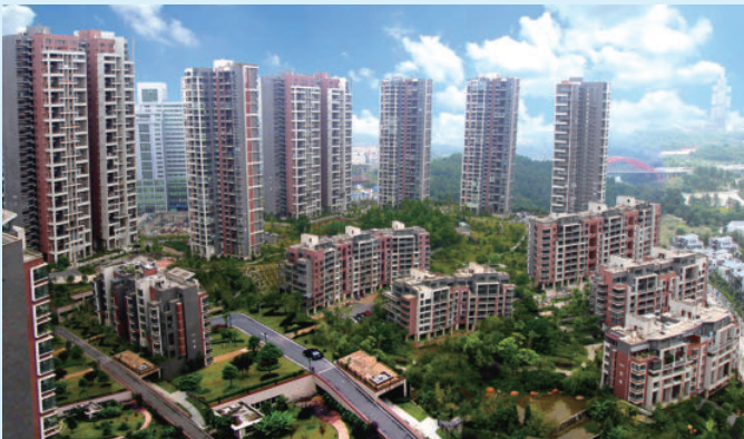
贵州省贵阳市观山湖 1 号项目，由电建建筑公司承建