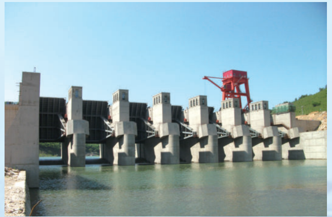
辽宁省宽甸满族自治县蒲石河蓄能电站下水库及金属结构安装工程，由电建建筑公司承建