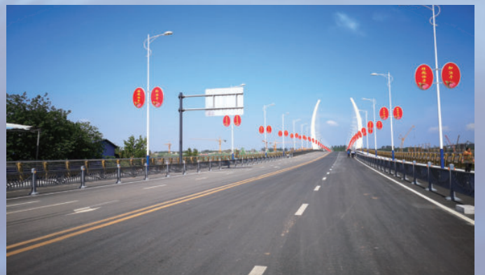
四川省彭山县彭河大桥 PPP 项目，由电建建筑公司投资建设