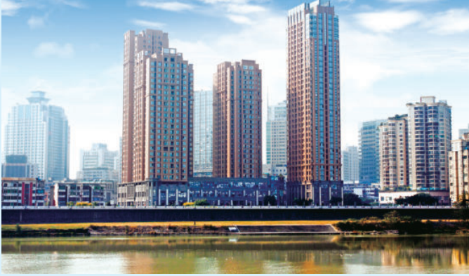
四川省绵阳市海赋外滩项目，由电建建筑公司承建