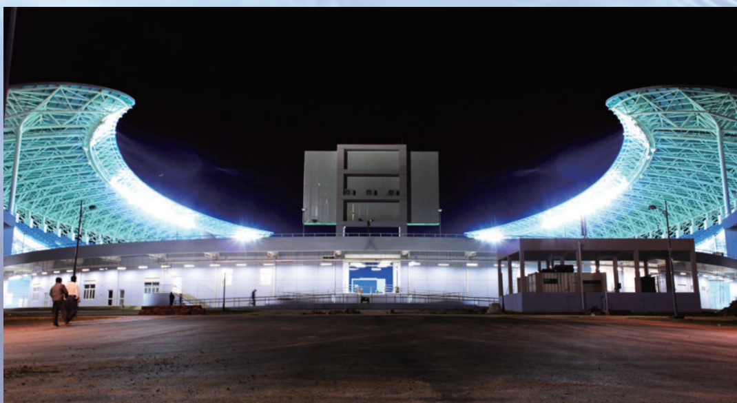
安哥拉卢班戈体育场项目，由电建建筑公司承建