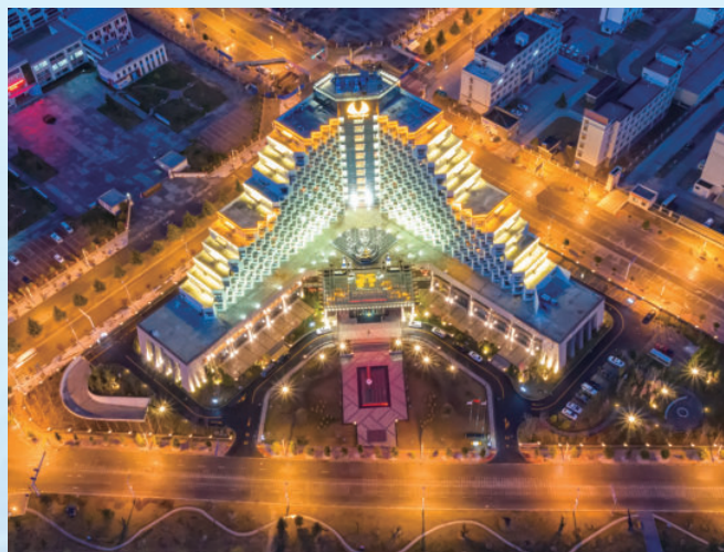
西藏自治区林芝地区五洲皇冠酒店项目，由电建建筑公司承建