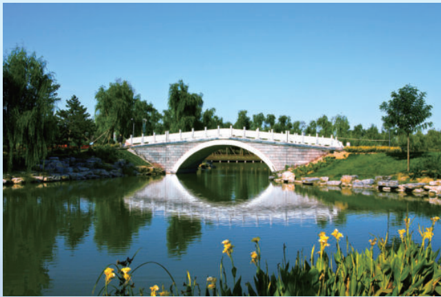
北京市大兴区念坛森林公园项目，由电建建筑公司承建