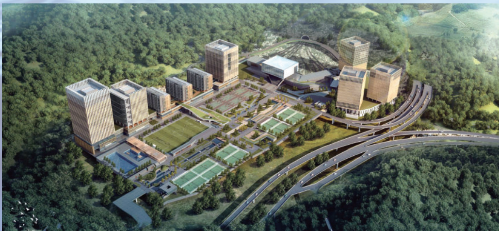
广东省深圳市轨道交通网络运营控制中心（NOCC）项目，由电建建筑公司承建，2016年获国家优质工程金质奖