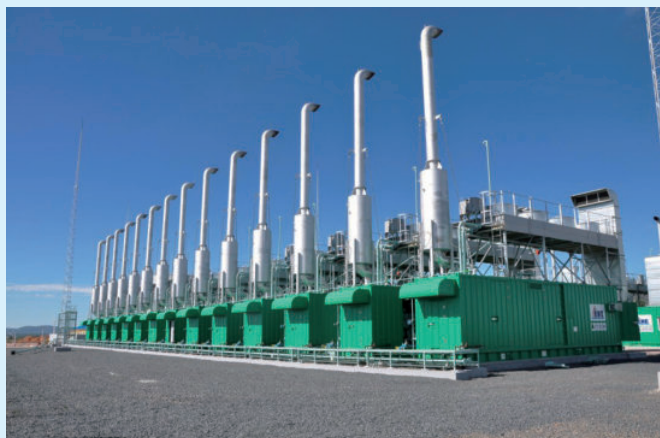
安哥拉卢班戈工业区 40MW 燃油电厂主发电机组项目，由电建建筑公司承建