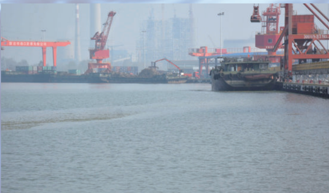
江苏省宿迁县运河港 PPP 项目，由电建建筑公司投资建设