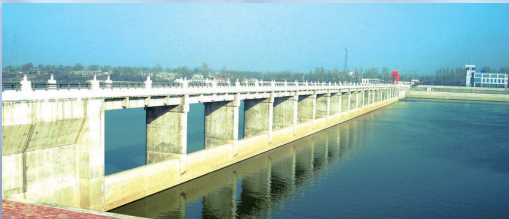
吉林省丰满三期扩建永庆反调节水库左岸土建工程，由电建建筑公司承建