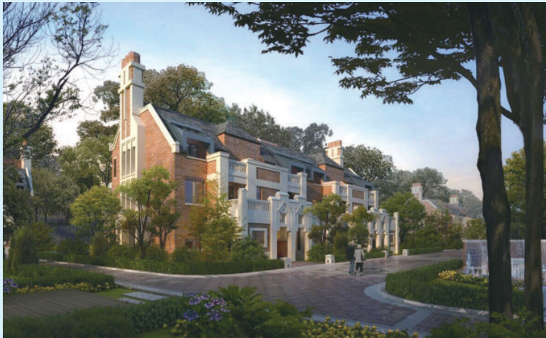
北京市门头沟区泷悦长安地产项目，由中电建建筑集团有限公司（以下简称电建建筑公司）承建，2017年获北京市建筑（结构）长城杯银质奖