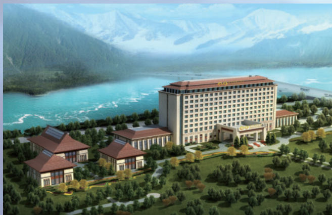
西藏自治区拉萨市华能凯莱大酒店项目，由电建建筑公司承建