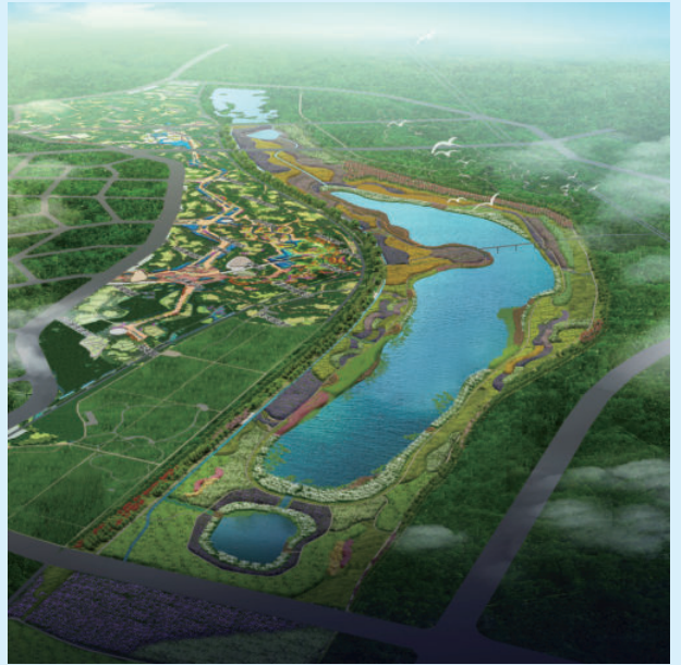
北京市永定河园博湖工程，由电建建筑公司承建，2014年获中国水利工程优质（大禹）奖