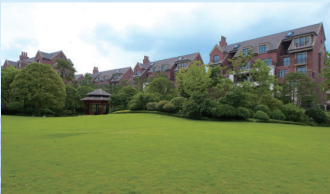
湖南省长沙市星湖湾项目，由电建建筑公司承建