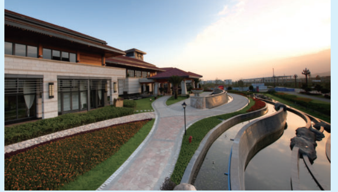
四川省都江堰市青云阶项目，由电建建筑公司承建