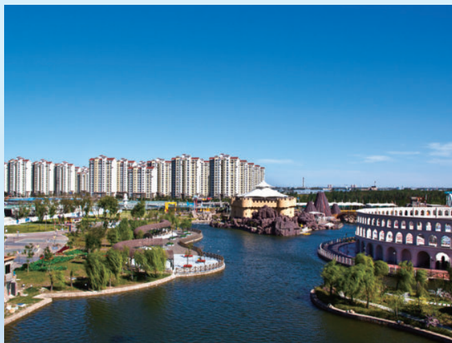
天津市武清区“新城开发”BT项目，由电建建筑公司承建