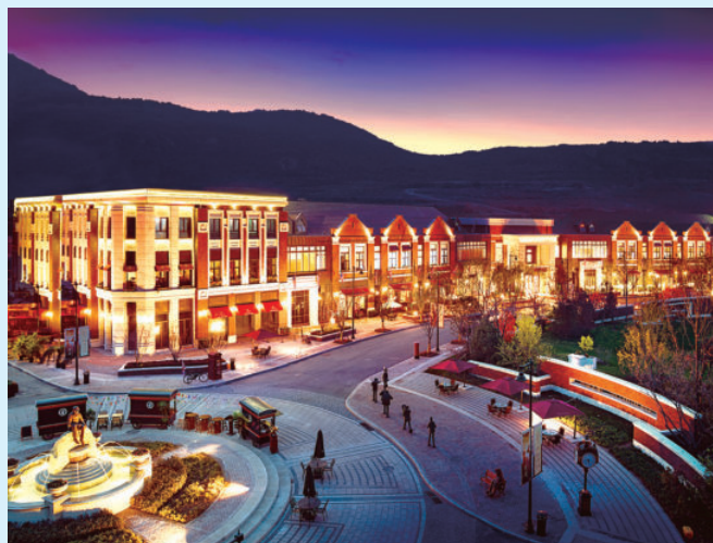
北京市门头沟区西山艺境项目，由电建建筑公司承建