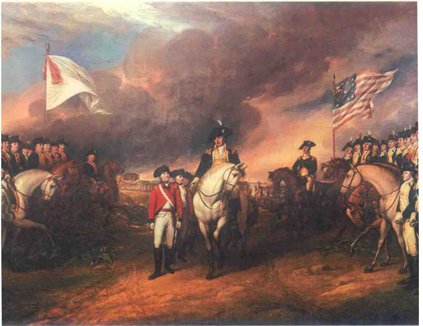
约克镇战役，美国独立战争战略反攻阶段的最重要战役