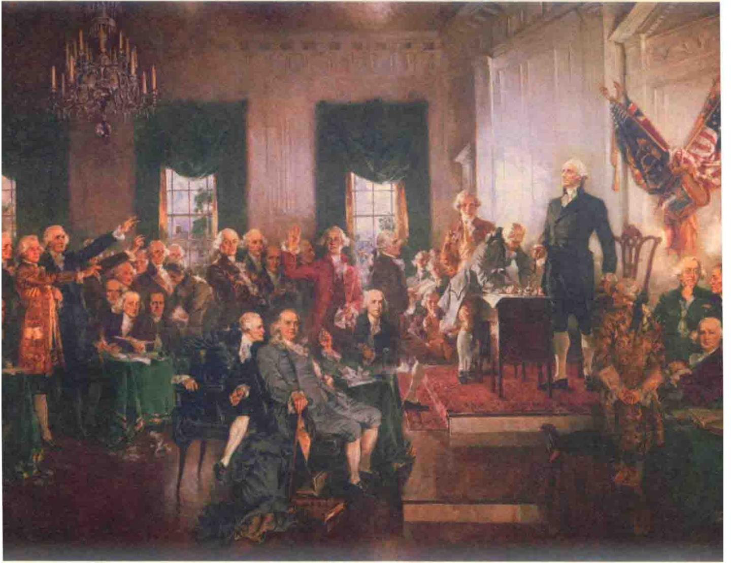
乔治·华盛顿、本杰明·富兰克林在美国《宪法》签署现场