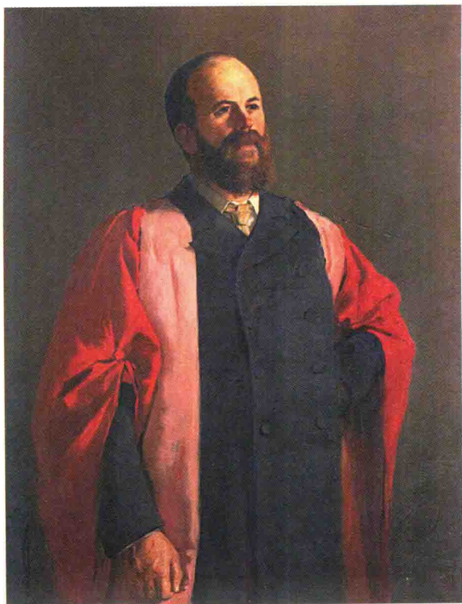
约翰·埃德温·桑兹 John Edwin Sandys, 1844—1922