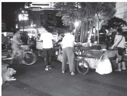
图 4 没警察看管的流动摊贩