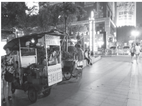
图 2 夜间宵夜摊

在学校、居民区和菜市场附近，有各类烧烤、砂锅和煎炸小食品等宵夜摊贩在夜间营业。经询问我们得知这些宵夜摊贩在西南街道起码要等到晚上 9 点半后才出来营业，而在乐平镇晚上 6 点半后他们就开始营业，一直到凌晨一两点还不收档。按理说这很正常。但这个时间段却是周边居民的最佳睡觉时间。这些流动摊贩在这时营业，炒菜、大声吆喝等会产生噪音，影响周围居民的睡眠。而烧烤、炒菜所散发出的气体也会影响空气质量。所以夜间流动摊贩会造成空气、噪音等污染，影响周边居民生活。