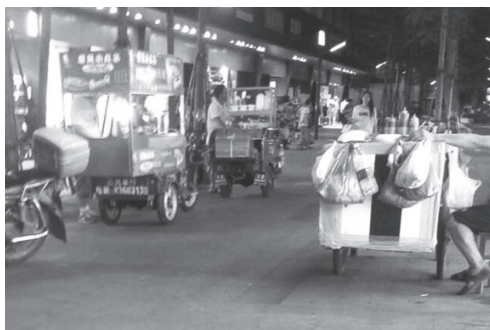
图 5 有警察看管的流动摊贩

相信这两幅图足以说明问题，所以我们建议城管部门应该加大巡查力度，可以借鉴其他城市的经验，成立专门的调查小组。然后根据流动摊贩的不同表现情况，对流动摊贩和其摊位进行不定期的检查，检查是否有不在指定区域营业的流动摊贩，还要不定期检查流动摊贩所贩卖商品的安全、卫生、质量等问题。减少流动摊贩和人们的纠纷。