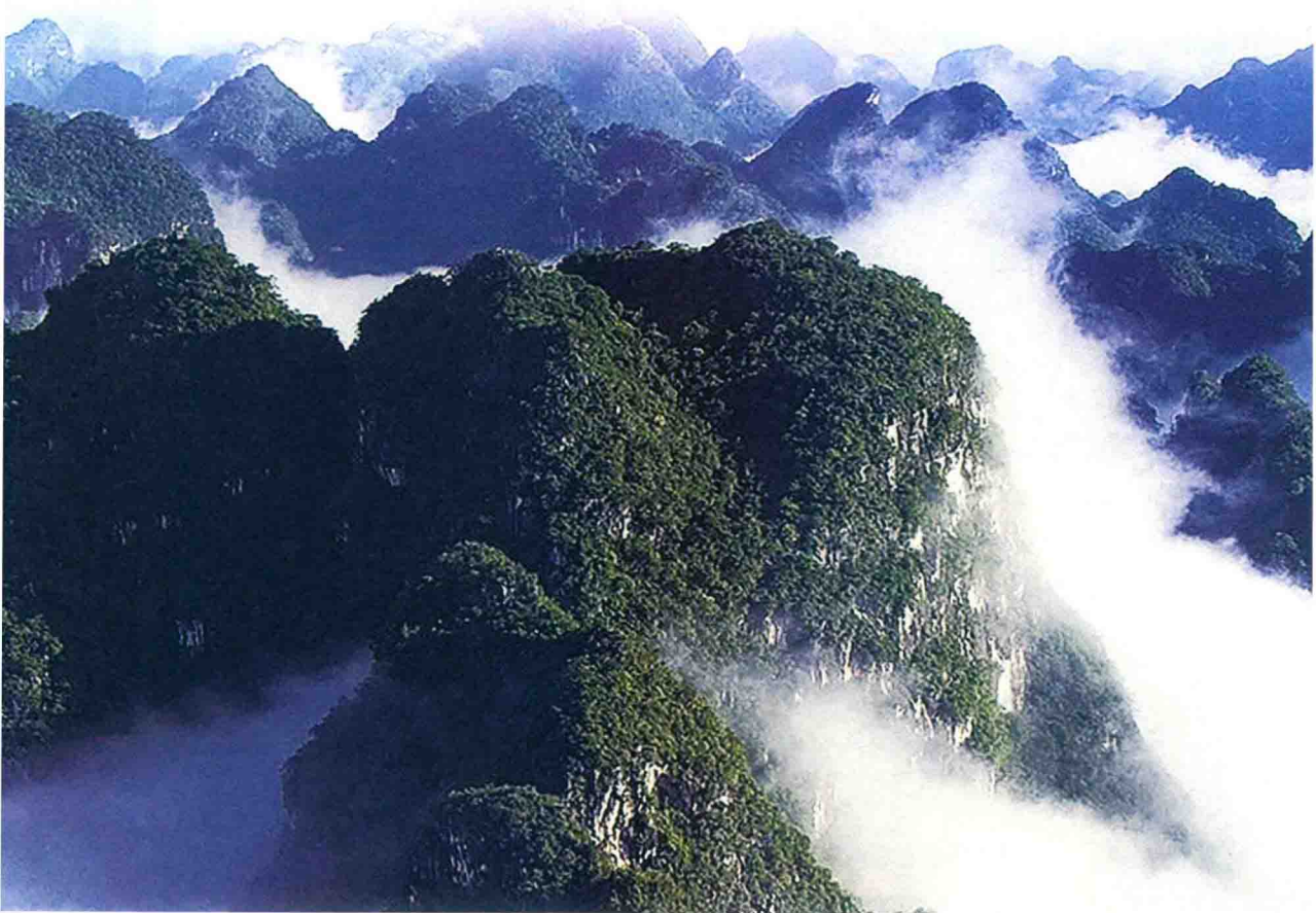
弄岗国家级自然保护区