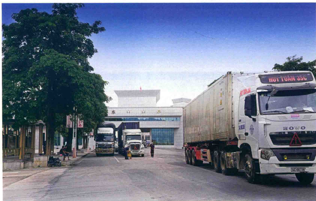
国家一类口岸——水口口岸