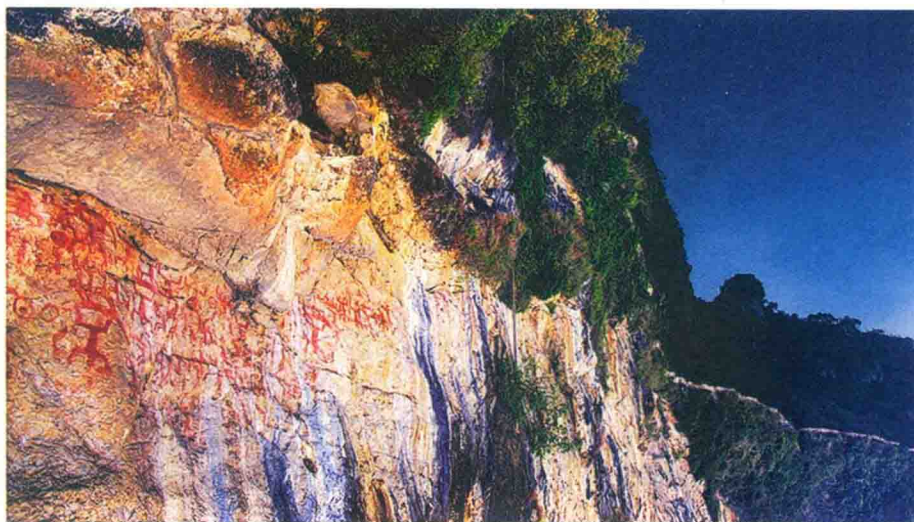
世界文化遗产——左江花山岩画文化景观