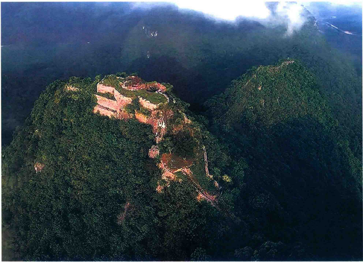
南疆长城——龙州小连城