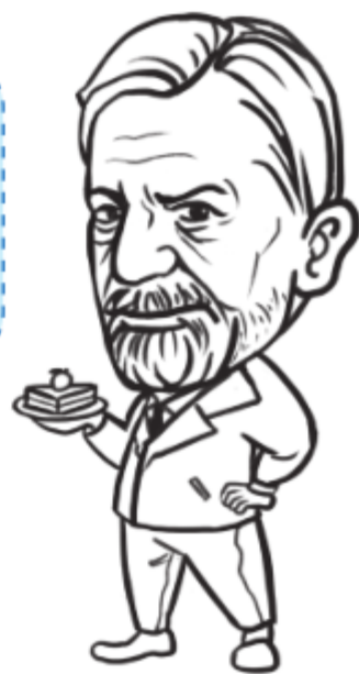
图1-3 弗洛伊德：梦的用途是减压

——也就是说，弗洛伊德认为白天人内心深处有欲望，被理智限制而不能实现，情绪积压就有害身体。梦就通过虚假的满足释放压力，但梦里也还残留了一些理智，所以梦是伪装和变形的。 简单地说，他认为梦的用途是减压。