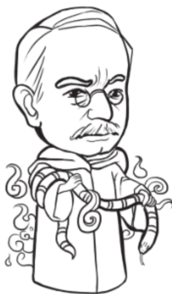
图1-4 荣格：梦的用途是传承和预示