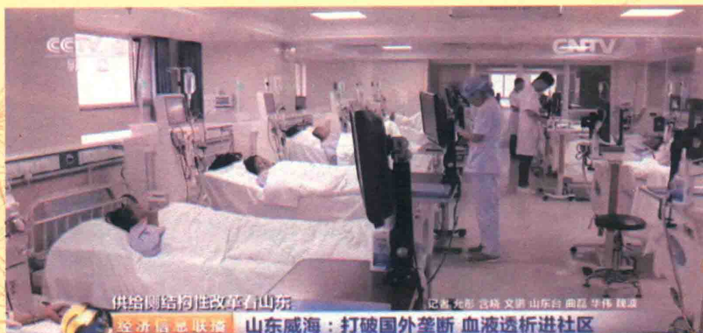
中央电视台新闻截图