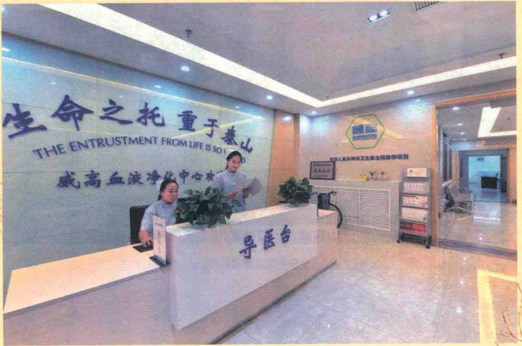
生命之托，重于泰山