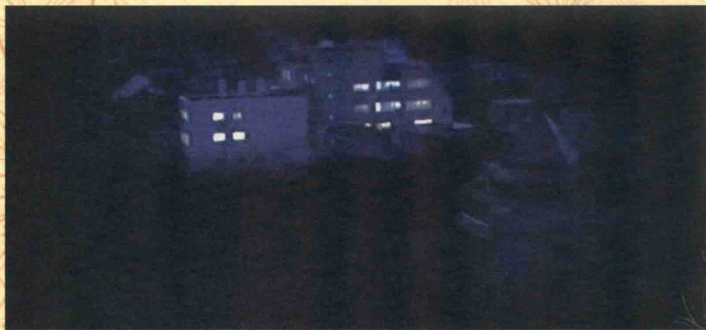
希望之光——大地震之夜的後藤医院