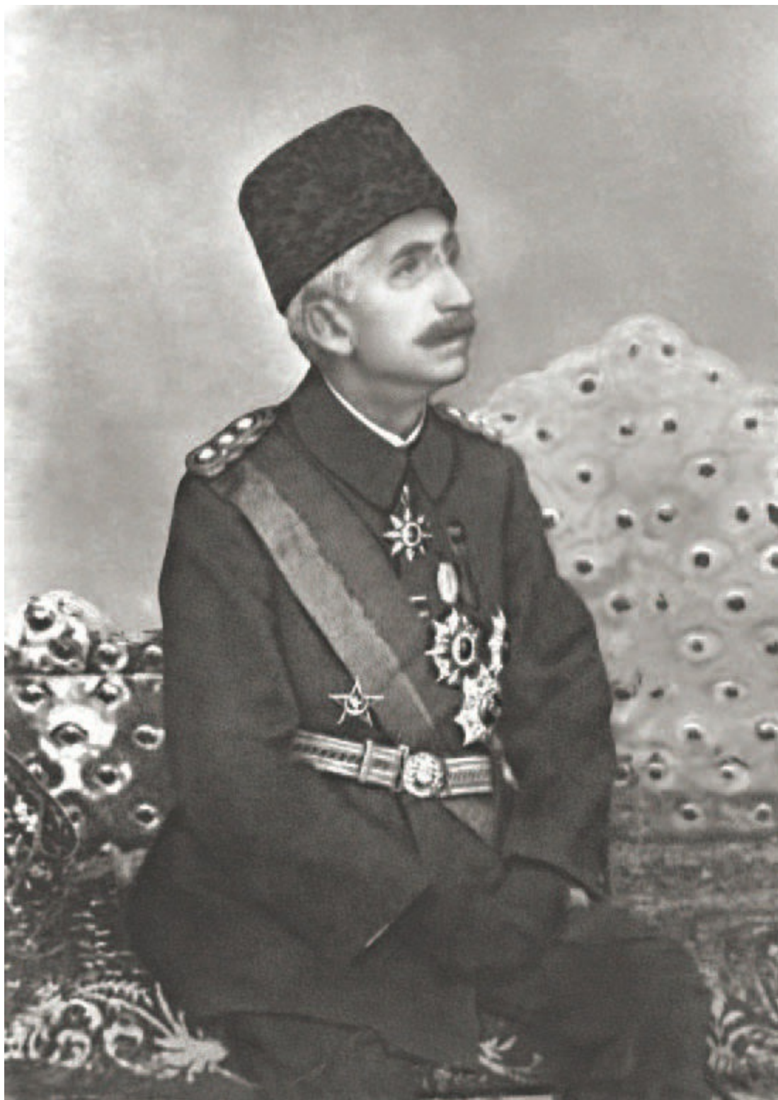
穆罕默德六世，奥斯曼帝国末代苏丹，1918—1922年在位（, 约1920年）