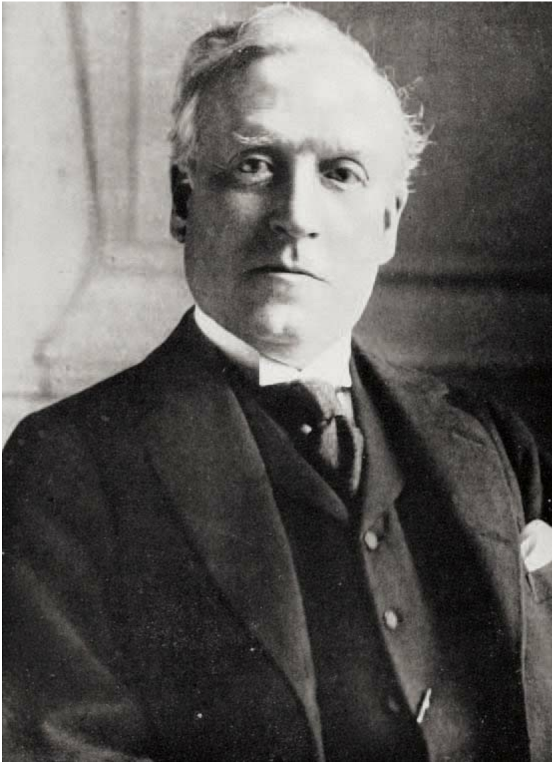
阿斯奎斯，1908—1916年任英国首相（Harold Begbie, Public Domain, 1921）