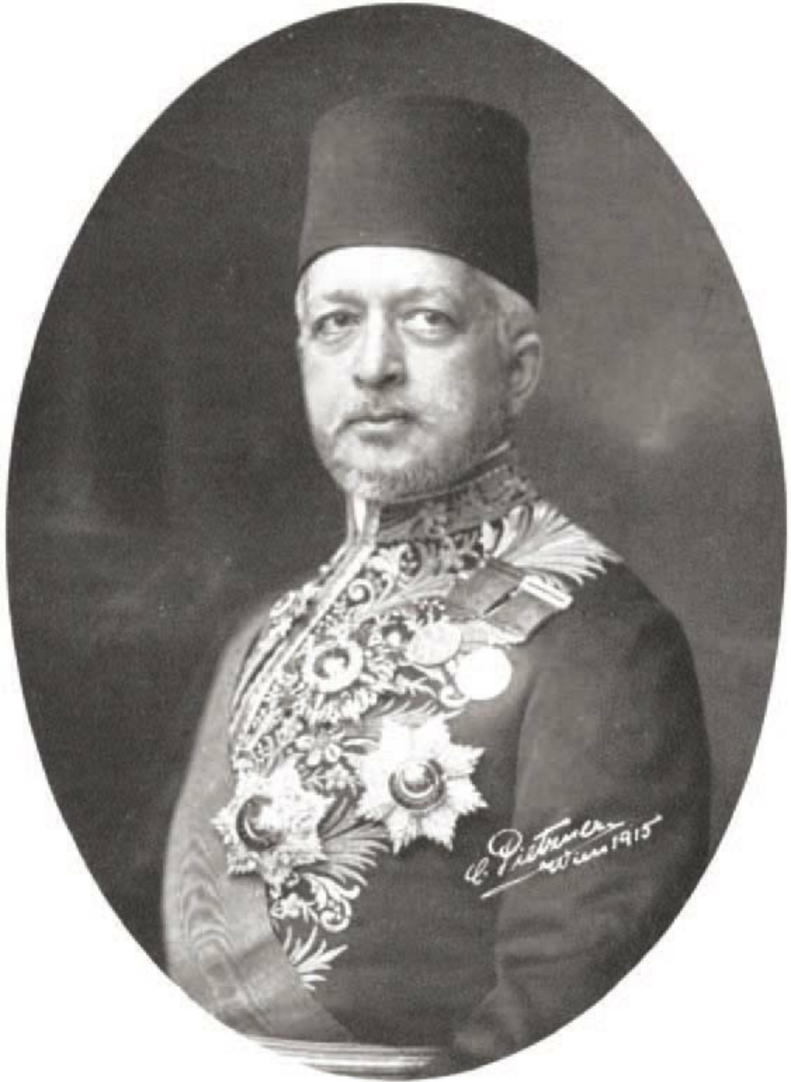
赛义德·哈利姆，1913—1917年任奥斯曼帝国大维齐尔