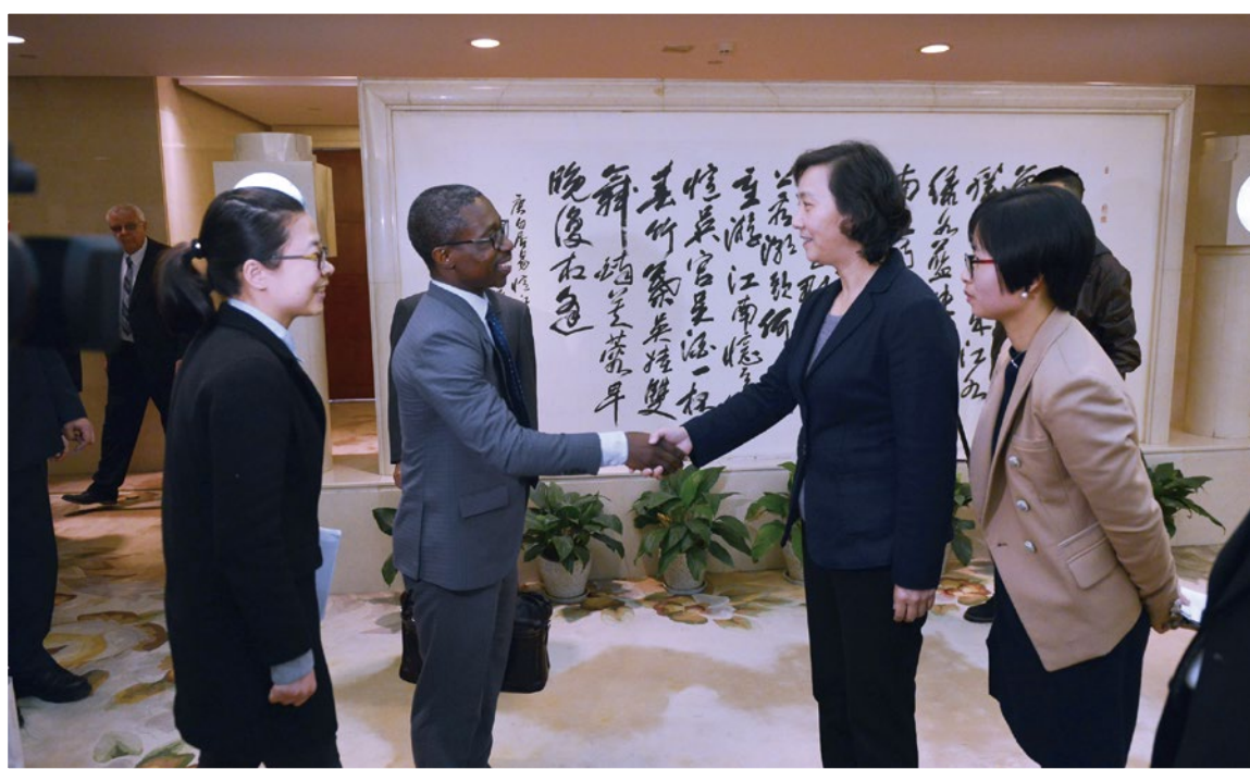
2018年3月22日，副省长、省人社保厅厅长王文序（右二）在省人民大会堂会见外国院士团队