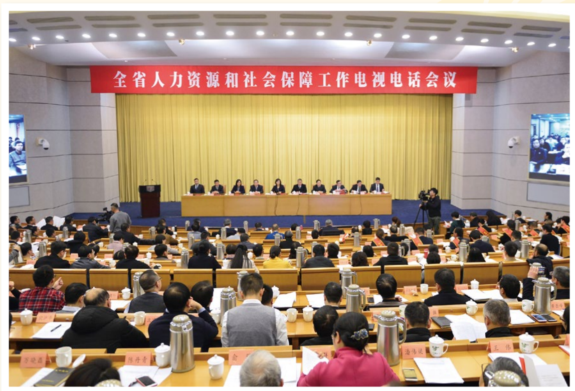
2018年1月17日，全省人力资源和社会保障工作电视电话会议在杭州召开