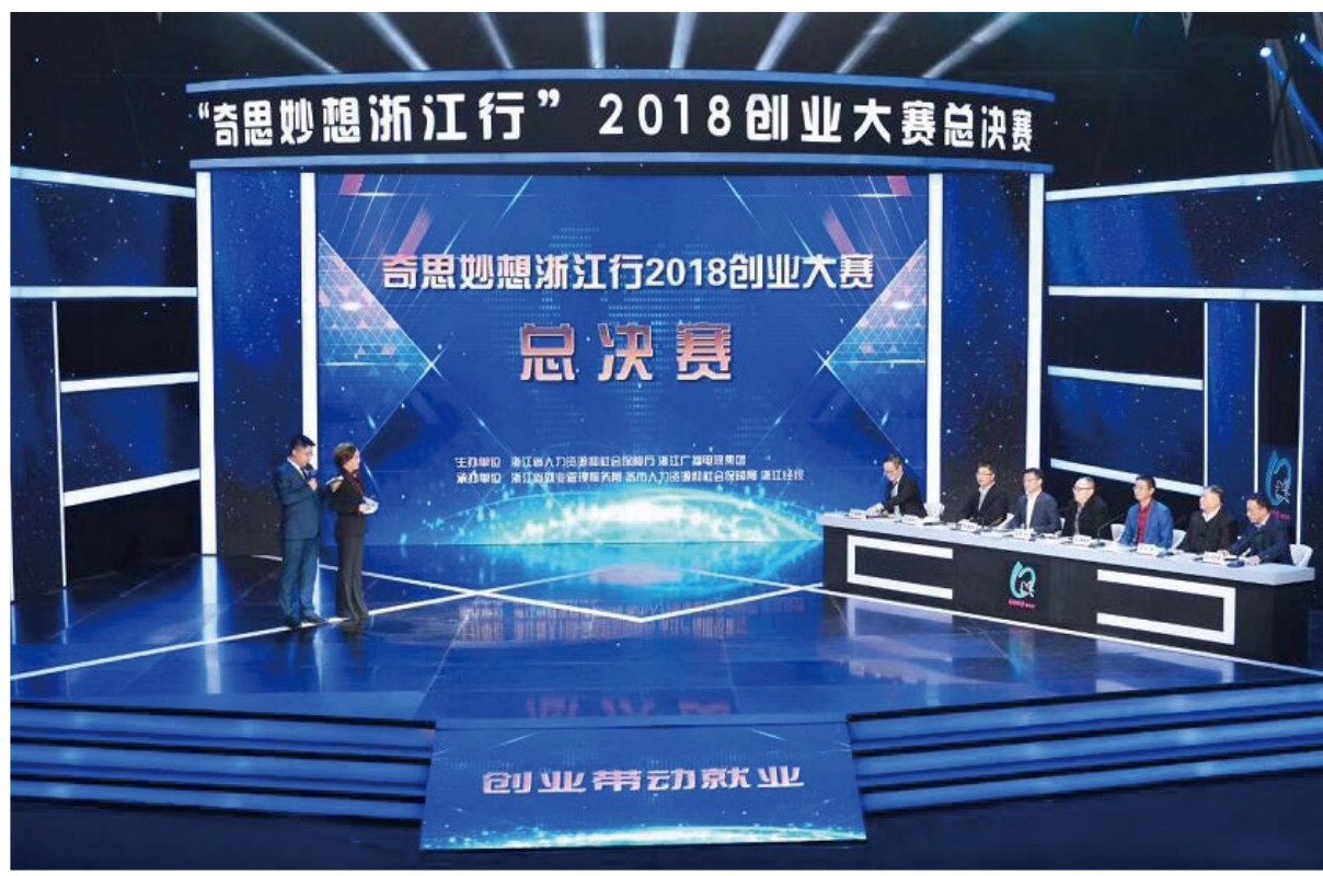
2018年12月20日，“奇思妙想浙江行”2018创业大赛总决赛在杭州举行