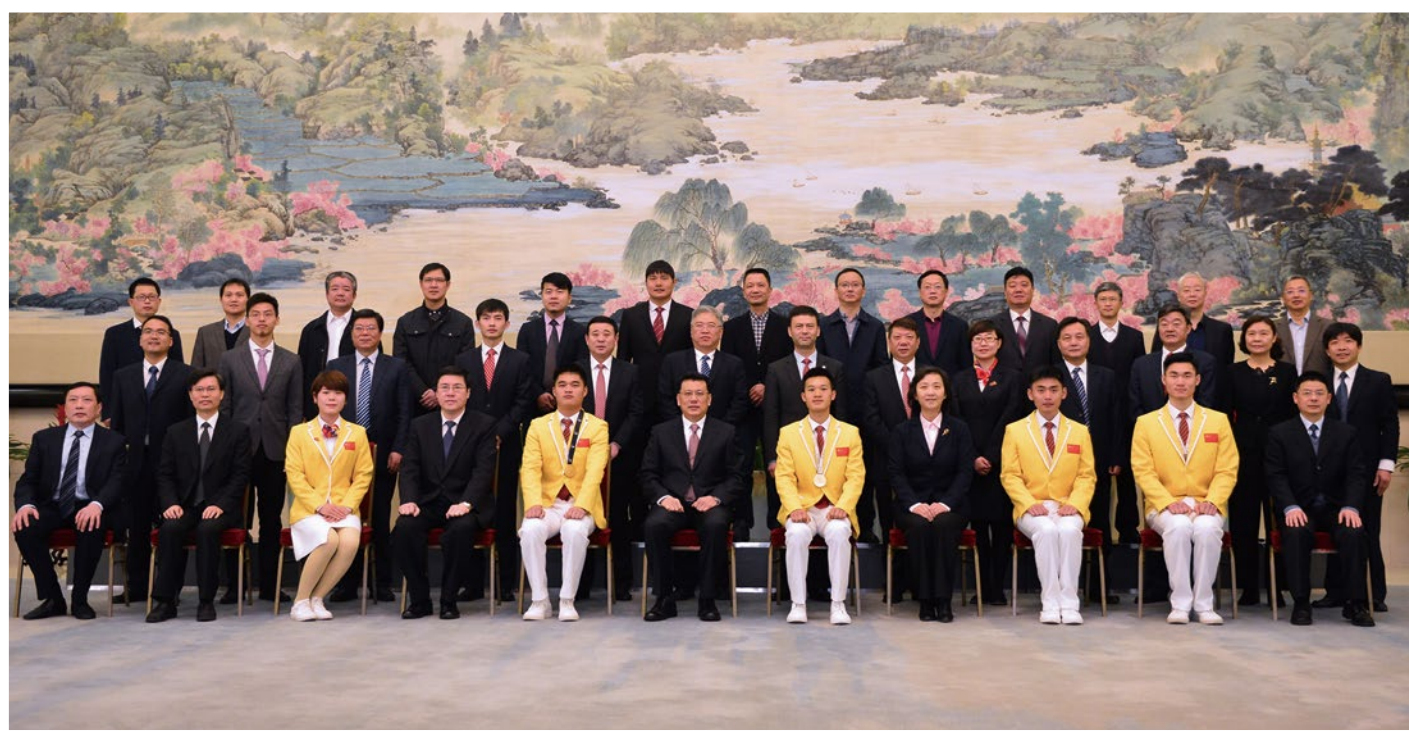
2018年3月2日，省长袁家军（前排中）等领导会见第44届世界技能大赛浙江代表团成员并合影留念