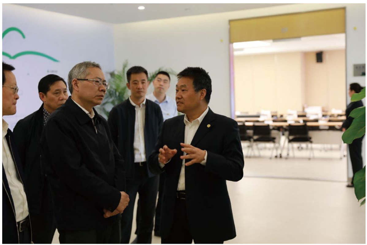
2018年4月25日，人社部副部长汤涛（左三）在之江实验室调研专业技术人才工作