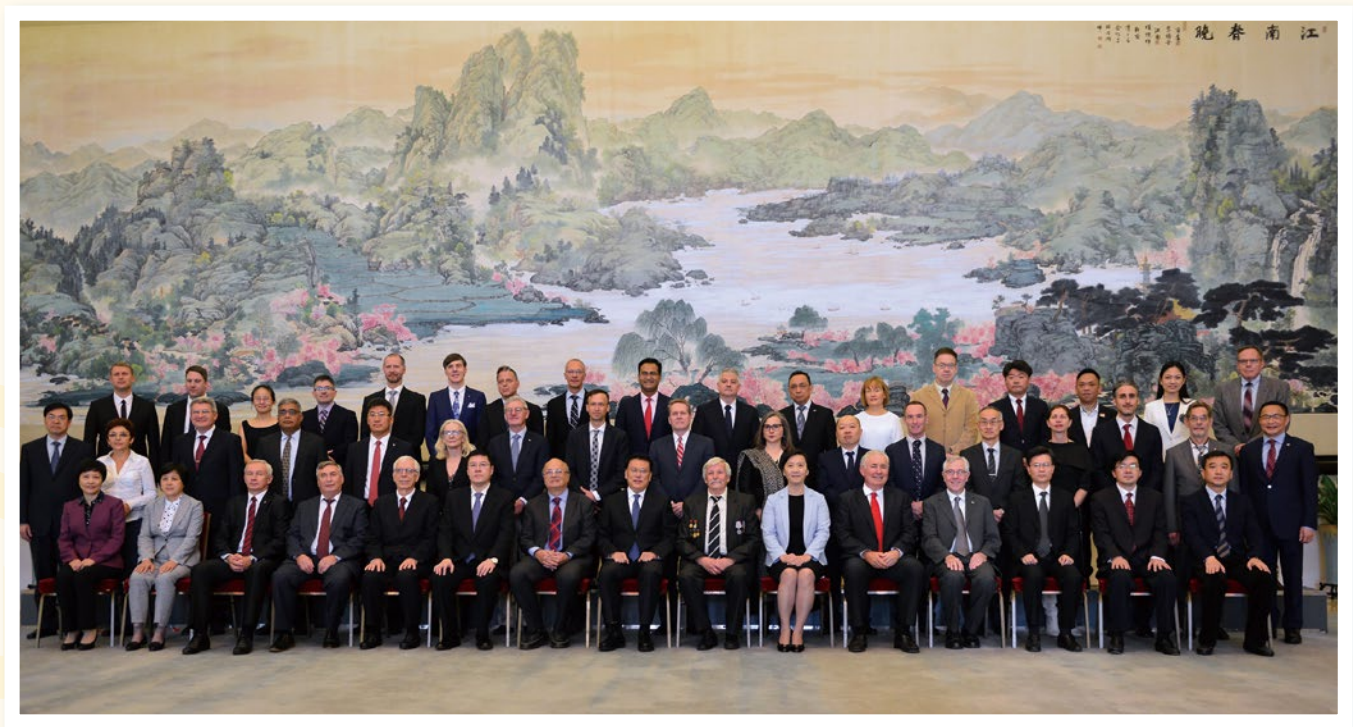
2018年10月30日，省长袁家军（前排中）等领导在省人民大会堂接见“西湖友谊奖”专家并合影留念