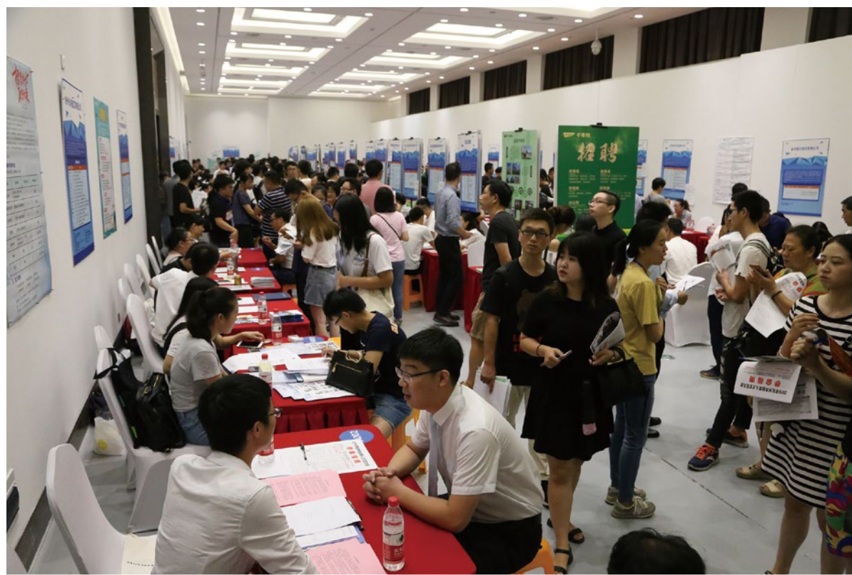
2018年9月15日，杭州市举办秋季人才交流大会