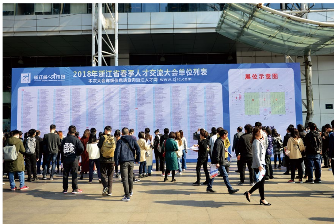
2018年3月13日，2018年浙江省春季人才交流大会在杭州举行