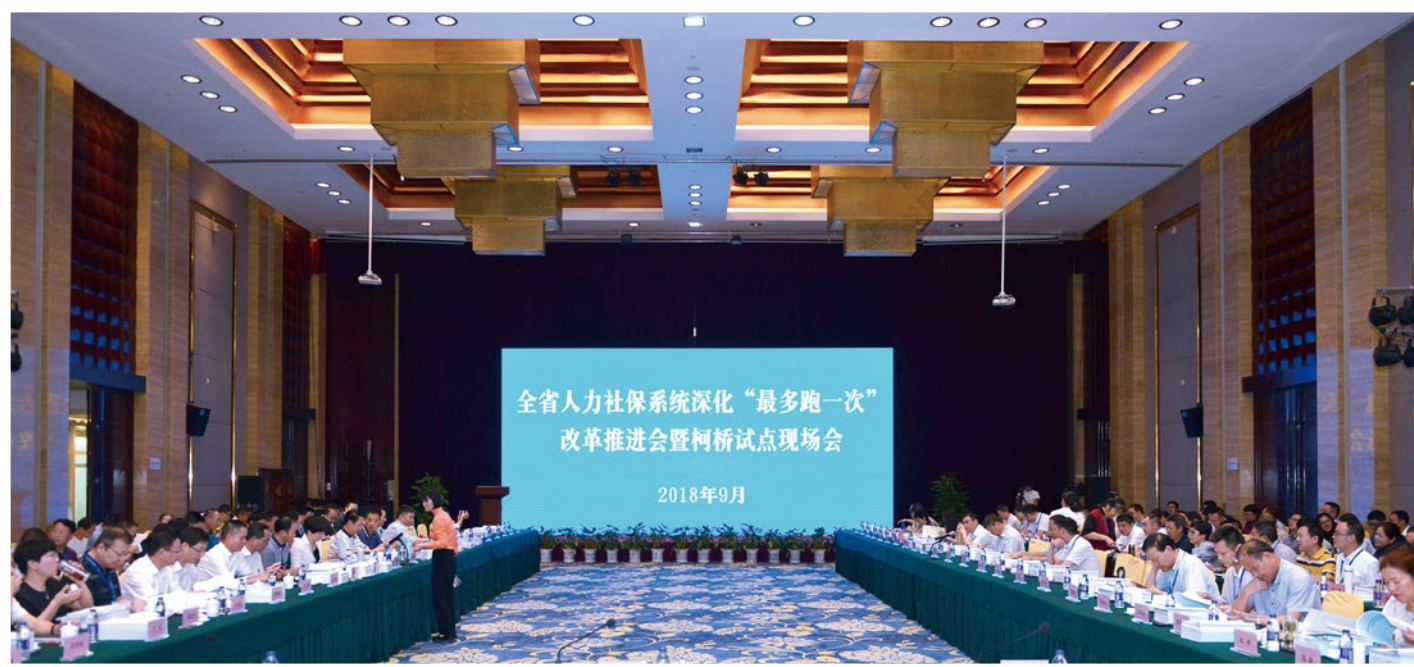
2018年9月26-27日，全省人社保系统深化“最多跑一次”改革推进会暨柯桥试点现场会在绍兴柯桥举行