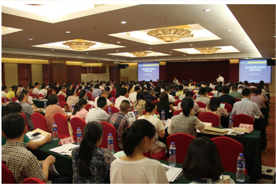
2018年7月10-13日，全省社会保险基金监督检查证申领培训班在湖州举行