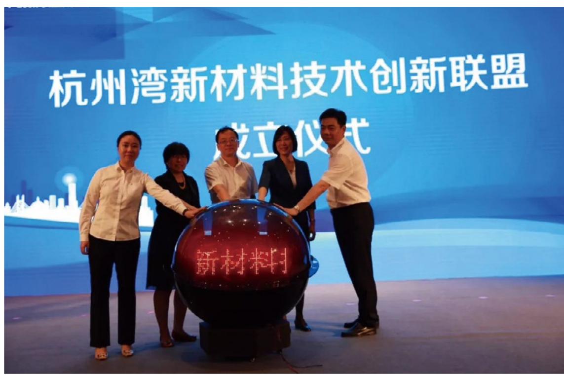
2018年5月18日，省人社保厅党组成员、副厅长龚和艳（右二）出席杭州湾新材料技术创新联盟成立仪式