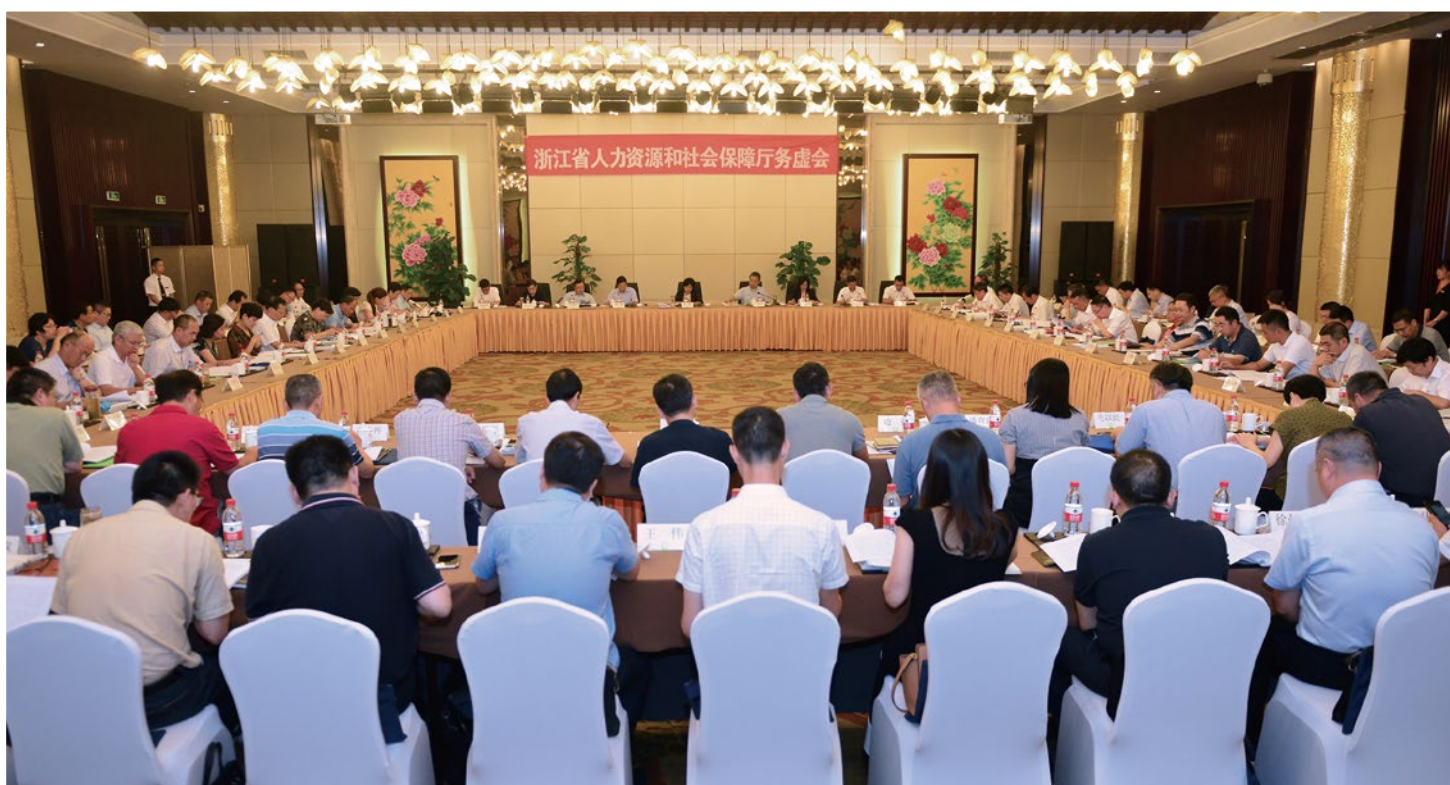
2018年8月14-15日，省人社厅务虚会在桐庐召开