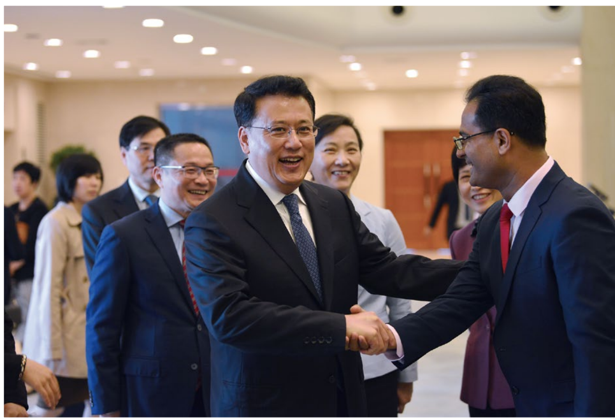
2018年10月30日，省长袁家军（中）等领导在省人民大会堂亲切会见“西湖友谊奖”的获奖外国专家