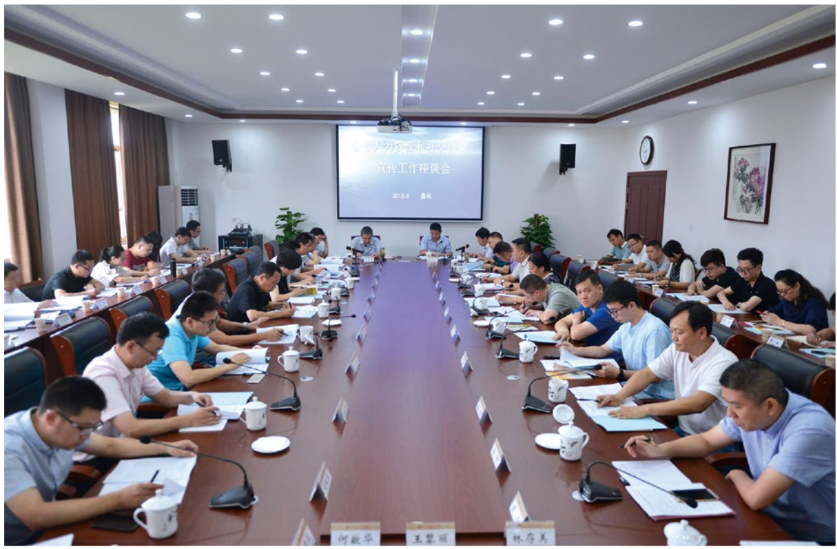
2018年6月27-28日，全省人力资源和社会保障宣传工作座谈会在嘉兴召开