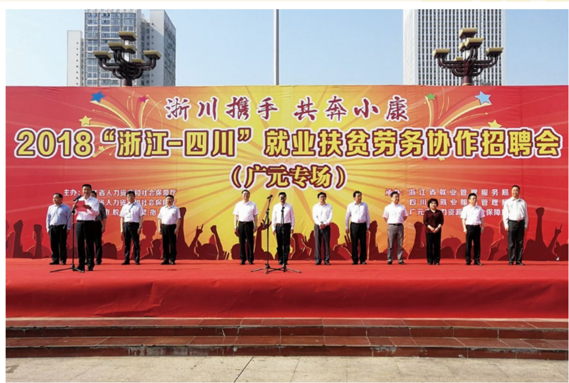
2018年5月14日，2018年度“浙江—四川”就业扶贫劳务协作招聘会在四川广元举行