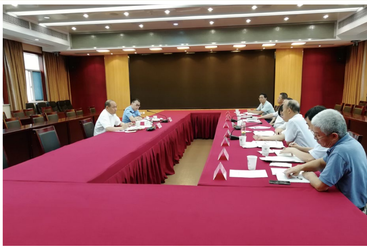
2018年9月11日，人社部副部长邱小平（左一）来浙江调研工作