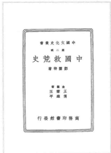
《中国救荒史》，商务印书馆， 1937年

2017年是该书出版80周年，国内外灾害史研究呈现出蓬勃发展的趋势，各类通史、断代史、灾害专题及区域灾害研究等著作纷纷涌现。学者在史料搜集、灾情灾况、灾异观念、救灾方式等方面有了深入论述。灾害史研究的兴起源于其具有的现实意义：灾害与人类生存息息相关，与历史变迁紧密相连，