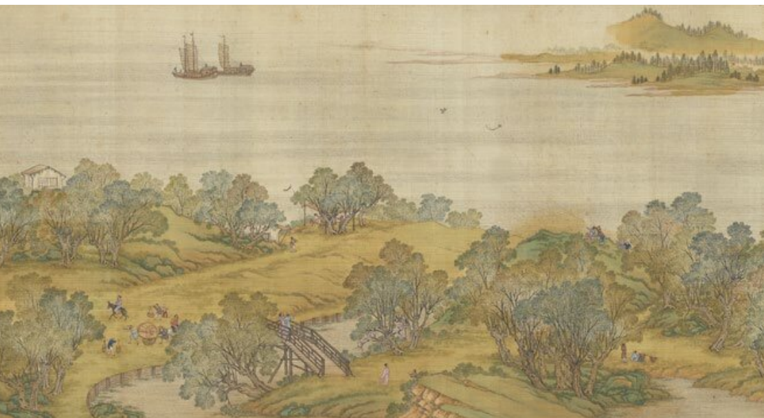
张择端《清明上河图》(局部)

画的中段描绘的是汴河及其两岸风光。北宋建都开封的重要原因之一，就是这里为蔡河、汴河、五丈河、金水河四条河流所环绕，漕运十分便利。据记载，经汴河年运输粮食物资六百万石，东南地区的粮食和其他物资都从这条河运到东京。宋朝人说汴河是立国之本，一点都不夸张。以开封周边的生产能力，是不够汴梁城上百万居民消费的。可以说，东京的繁荣不是因为开封的生产力，而是因为漕运的运输力。宋太祖曾几次提出迁都，但每次都因为开封那无可匹敌的漕运优势作罢。