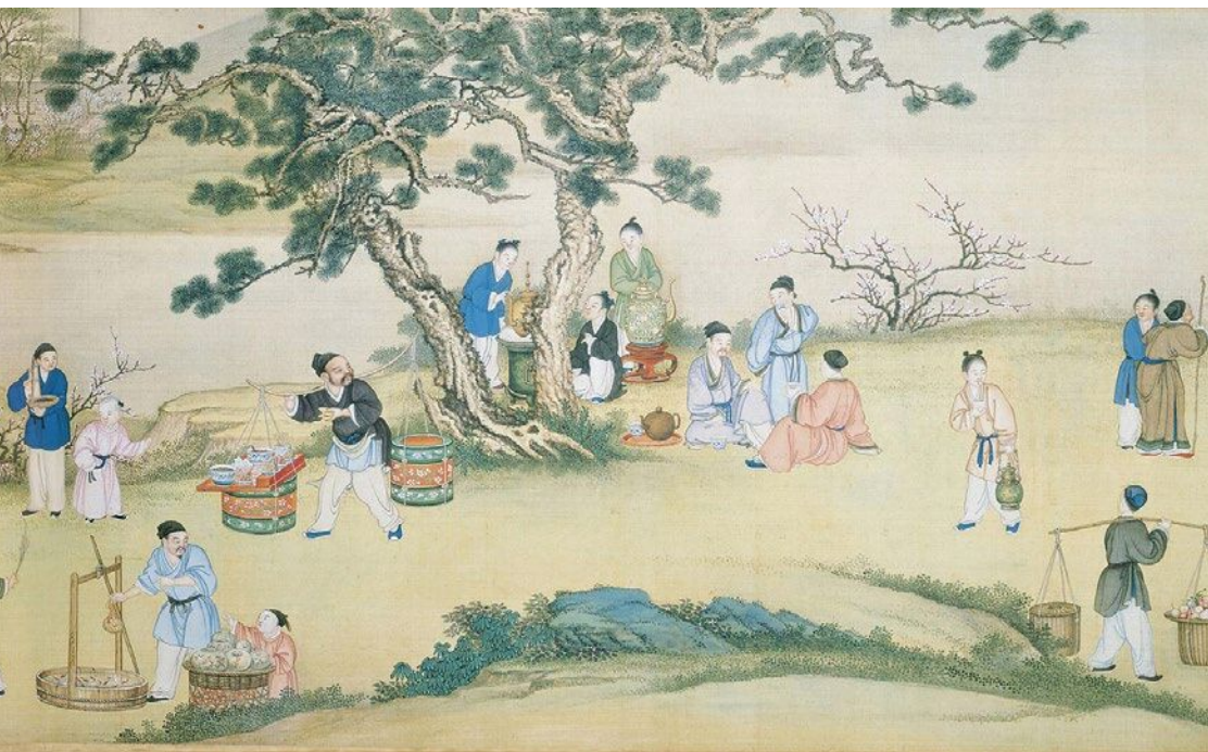
丁观鹏《太平春市图》

容易触动人们敏感的神经，历来受到讲求“慎始敬终”的传统社会的普遍重视，成为汉文化圈内最重大的节日。