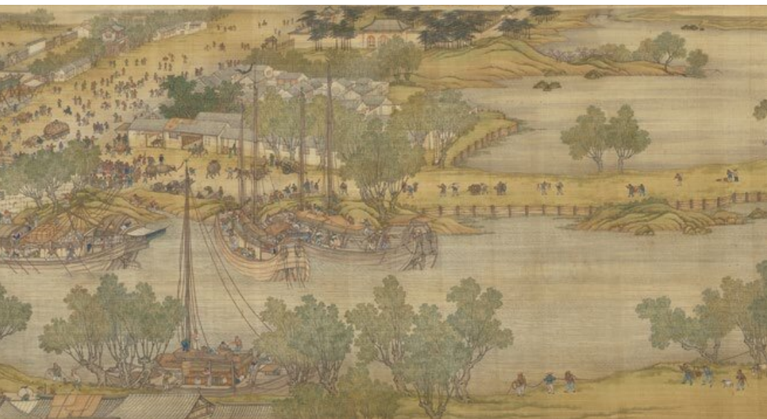
张择端《清明上河图》(局部)

有21匹，甚至大车都用黄牛、水牛拖拉。这与宋代马政不昌息息相关。一方面，宋朝并未实现大一统，北部、西北这些传统的适合养马的区域均不在宋的版图之内，而是被辽、金、西夏等周边民族政权占有。在冷兵器时代，牧马的场所也与双方战力之盛衰有决定性的关系。为了保证骑兵优势，辽、金、西夏对于宋人获取马匹严加防范。《辽史》说得很清楚，与宋互市时，马匹不许出境，“每擒获鬻马出界人，皆戮之，远配其家”。另一方面，马匹原本也可以在华中繁殖，只是受当地农业经济的限制，极难维持，而且精密耕作地区所育马匹一般较为瘠劣。这样一来，宋人缺马的窘迫程度不言而喻，《清明上河图》里多用牛车也就在情理之中了。