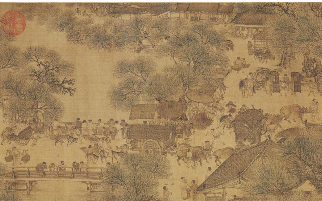
张择端《清明上河图》(局部)

说来相当可惜，历史资料关于张择端本人的记载实在少之又少。因此对此人的身世，今天所知十分有限。我们只能从《清明上河图》上金人张著的跋文中略知大概：“翰林张择端，字正道，东武人也。幼读书，游学于京师，后习绘事。本工其界画，尤嗜于舟车、市桥、郭径，别成家数也。”这段跋文作于金世宗大定丙午即公元1186年，距离北宋灭亡已经一个甲子。写下这段跋文的张著在金朝泰和五年（1205）任职监御府书画，也就是鉴定书画的行家。正是他在跋文中描述了张择端的生平，我们才由此对张择端有了略微了解。从中可以推断出，张择端是东武（今山东诸城）人，在古代交通不便的情况下，能从离汴京一千五百里远之外来到汴京求学，想必家境较为富裕，否则也不可能做到。他在翰