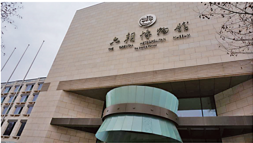
南京六朝博物馆，其英文译名是“The Oriental Metropolitan Museum The 3rd-6th Century”，直译回中文就是“3—6世纪的东方大都会博物馆”

早在先秦时代，南京所在的长江下游沿江区域已成为“吴文化”的起源和早期发展之地。但春秋至两汉的近1000年间，江南地域的中心城市在太湖平原，南京区域被相对边缘化。一直到东汉晚期，随着黄河流域经济与文化的衰落、政治的动乱和北方草原文化的南向扩张，南京的地缘优势才开始真正展现，一举成为中国东南地区政治势力的依托中心和文化的集聚地（东吴），接着又成为从黄河流域南移的中原传统政治势力和传统文化的保存中心（东晋），其城市政治统治区迅速通达大半个中国，文化辐射力波及东亚列国。诚如日本学者吉村怜生所说：“从文化上来说，6世纪的南朝（按：以南京为中心）宛如君临东亚世界的太阳，围绕着它的北朝、高句丽、百济、新罗、日本等周围各国，都不过是大大小小的行星，像接受阳光似的吸取从南朝放