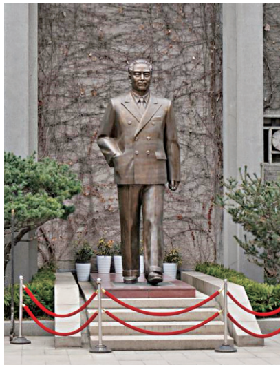
梅园新村纪念馆前的周恩来像