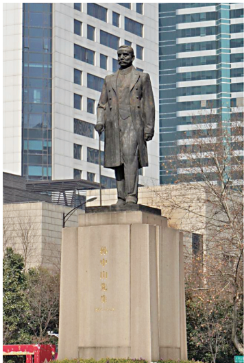
新街口广场上的孙中山像