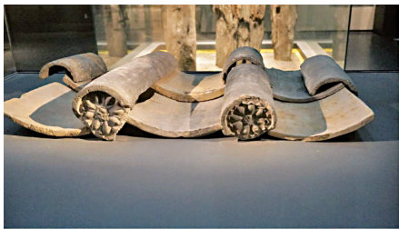
六朝建康都城遗址及出土的建筑构件