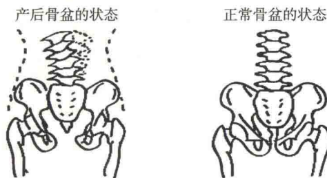
图3 分娩前后骨盆状态X线片对比示意图