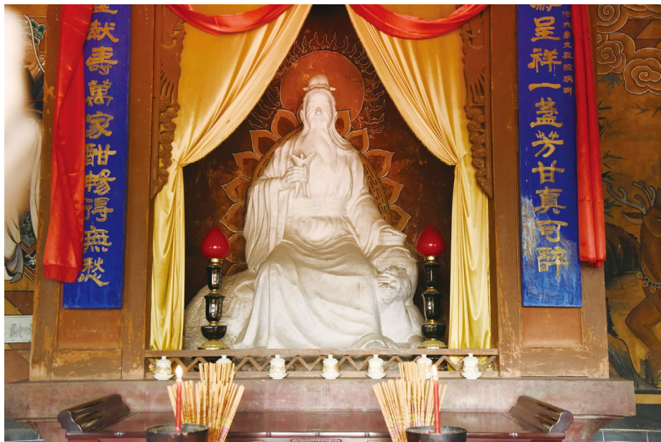
▲ 河南汝阳杜康造酒遗址公园里的杜康像