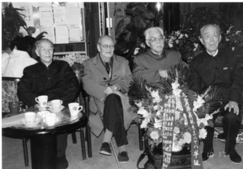
季羨林与好友在八十八华诞上的合影