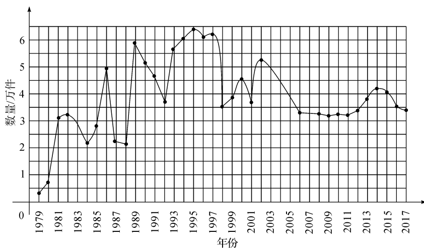
图 1-2 改革开放以来(1979—2017 年)中国腐败案件数量统计

数据来源:最高人民法院工作报告(1980—2018 年),转引自曹冬英:《改革开放 40 年中国廉洁政治生态的演变与优化》,《广州大学学报(社会科学版)》2018 年第 6 期。