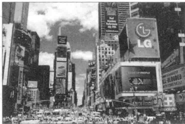
纽约时代广场的跨国企业广告

随着全球化的深入,这种着眼于艺术附加价值,关注艺术产业、经济功能的政策逐渐受到质疑,“经济至上主义主导的艺术政策一定程度上加剧了国家和地区间文化的竞争”。艺术与资本的结盟,使得艺术成为符号化的资本,随着资本的流动,艺术作为产品和成功的商业模式被不断复制。现今,各类知名企业的商业广告标识和霓虹灯招贴牌充满了不同城市的公共空间(见图0-2),渔人码头、SOHO、迪士尼乐园等成功的商业艺术模式被不断地复制。