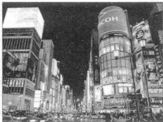
东京银座的跨国企业广告