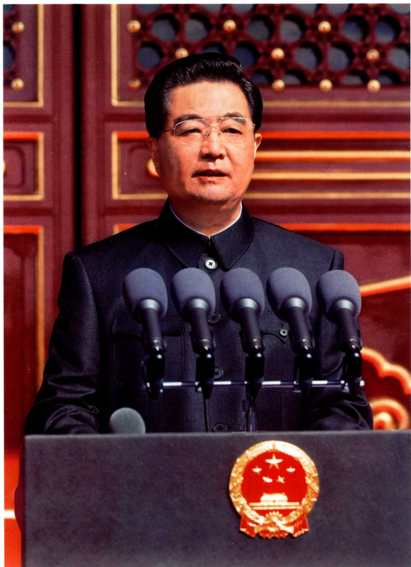
2009年10月1日，胡锦涛在庆祝中华人民共和国成立60周年大会上发表重要讲话