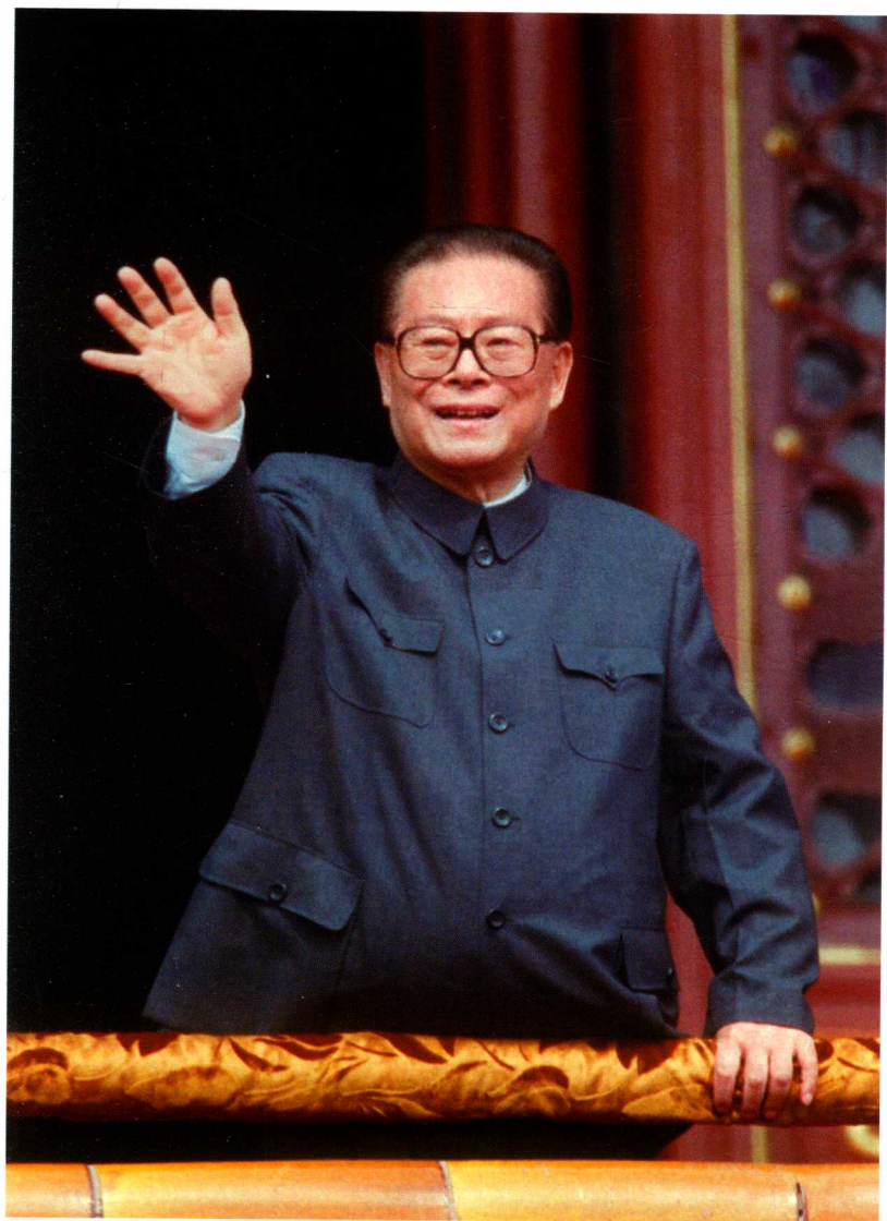
1999年10月1日，江泽民在天安门城楼上向参加庆祝中华人民共和国成立50周年大会的群众游行队伍挥手致意