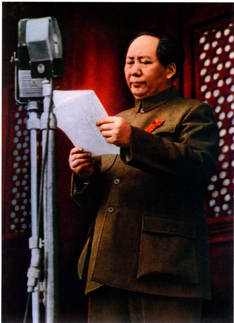
1949年10月1日，毛泽东在天安门城楼上庄严宣告中华人民共和国中央人民政府成立