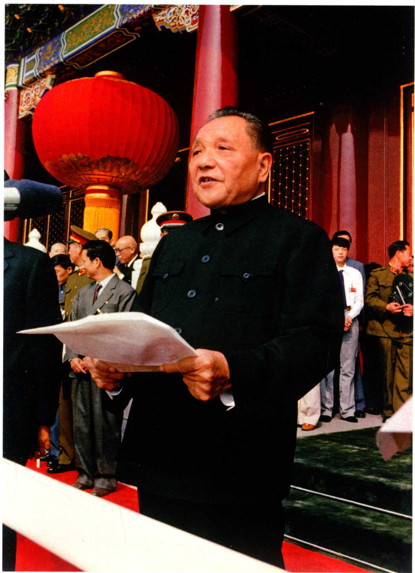
1984年10月1日，邓小平在中华人民共和国成立35周年庆祝典礼上发表重要讲话