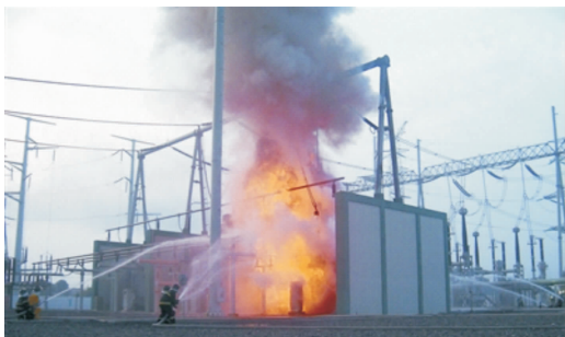
图 1-6 E类火灾