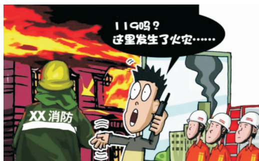
图 1-9 火灾报警

6. 报警后,本人立即或派人到单位门口、街道口或交通路口迎候消防车,带领消防队迅速赶到火场。