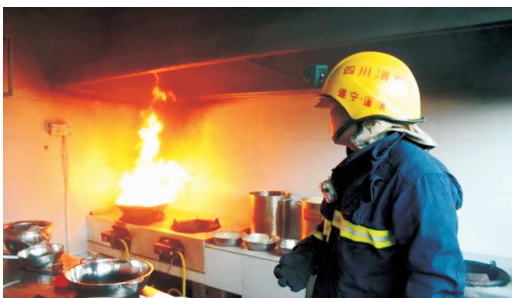
图 1-7 F类火灾