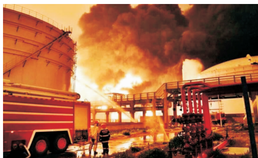
图 1-3 B 类火灾