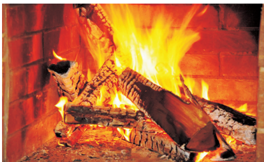
图 1-2 A 类火灾

B 类火灾(见图 1-3): 是指液体或可熔化的固体物质火灾,如汽油、煤油、柴油、甲醇、乙醇、沥青、石蜡、塑料等火灾。