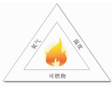
图 1-1 燃烧三要素

碰撞、摩擦、绝热压缩。机械火源是通过将物体间相对运动(摩擦、碰撞、压缩等)产生的机械能转变成热能的一类引火源,如撞击、摩擦产生的高温火花能点燃棉絮以及易燃气体、粉尘等。绝热压缩点燃是指快速压缩的气体温度会骤然升高,当温度超过自燃点时,可燃物便会发生燃烧。如生活中给自行车打气时,会发现打气筒温度明显上升。据计算,常温(20℃)常压下 1 体积的空气,经绝热压缩使体积压缩一半,这时的压力可上升 2.6 倍,温度会升高到 115℃。