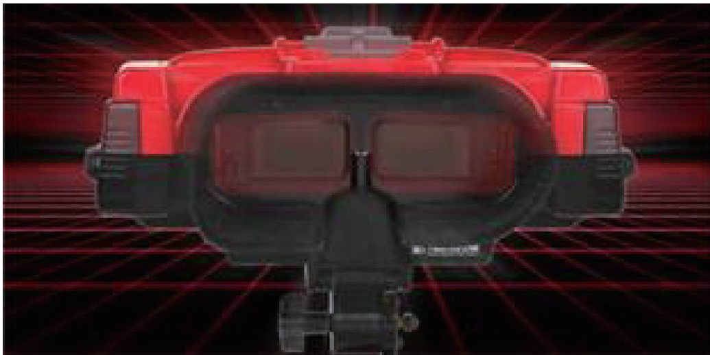
图1-12 任天堂Virtual Boy

1994年3月, 在日内瓦召开的第一届WWW大会上, 首次正式提出了VRML这个名字。后来又出现了大量的VR建模语言, 如X3D、Java3D等。同年, Burdea和Coiffet出版了《虚拟现实技术》一书, 在书中, 他们描述了虚拟现实的三个基本特征: 3I (Imagination, Interaction, Immersion)。这是对虚拟现实技术和理论的进一步完善。