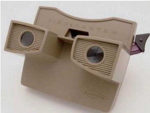
图1-5 GAF Viewmaster

1966年，最早的3D头戴设备之一—GAF Viewmaster（图1-5）出现。它通过内置两块镜片进行幻灯片的观赏，有一定的3D效果，但不是专业的影音设备。人们对其后续版本加入了音频功能，简单的多媒体功能得以实现。