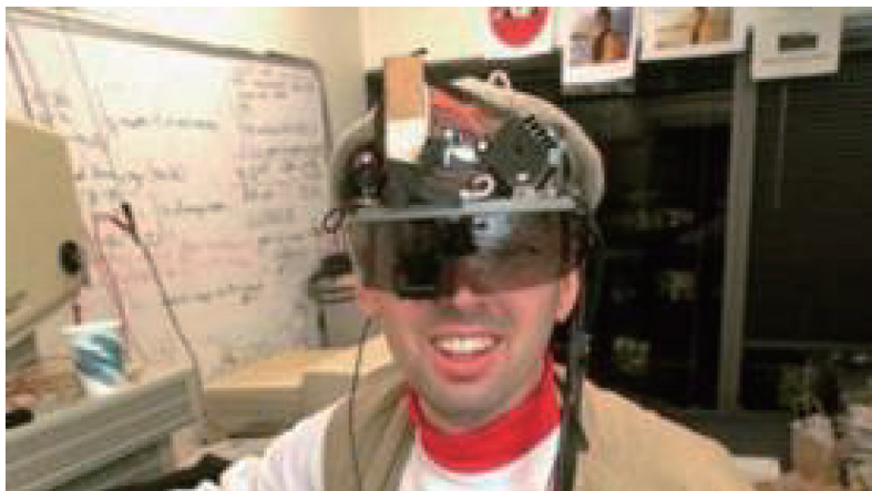
图1-8 Eye Tap