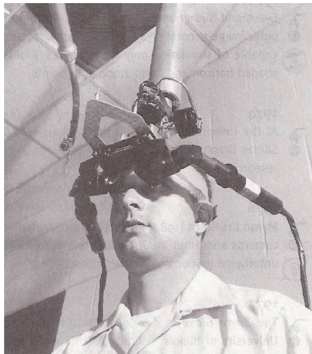
图1-7 Sword of Damocles（二）