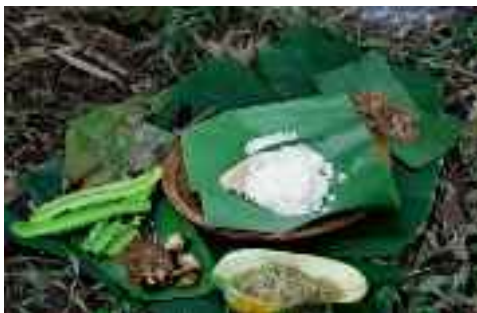
姐妹淘在芭蕉叶餐桌上的午餐

调味香料不只在锅里发挥作用。我早已看到人们开发出各种方法，收集植物的香气，融入食物中。我的芭蕉叶，她们可以随手摘下，裹好猪肉泥，再利用炭火的余温烤热。芭蕉叶的香气渗入肉中，鲜美异常。