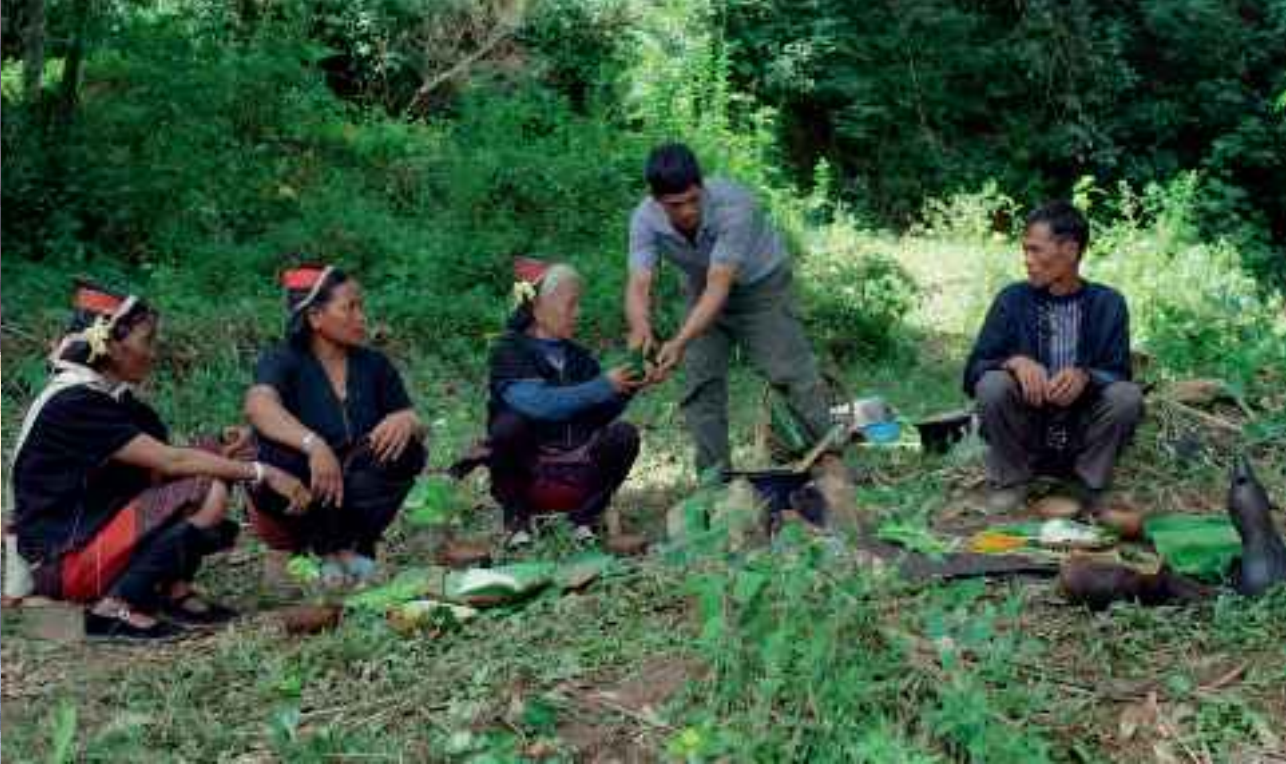
鸡肉烂饭由祭司分发

香气四溢中，凉拌黄瓜，包烧猪肉，野豆角，都已经摆上了叶盆姐妹的芭蕉叶餐桌。由于自古以来，鸡都是佤族祭祀占卜时使用的工具，因此，鸡肉烂饭这道菜，必须由祭司来分食。在这个充满各种味道诱惑的环境里，人们反而发展出了平衡食欲冲动的文化传统。即使是多年姐妹淘的私人聚会，也绝不会出现饭一出锅就哄抢一空的场面。