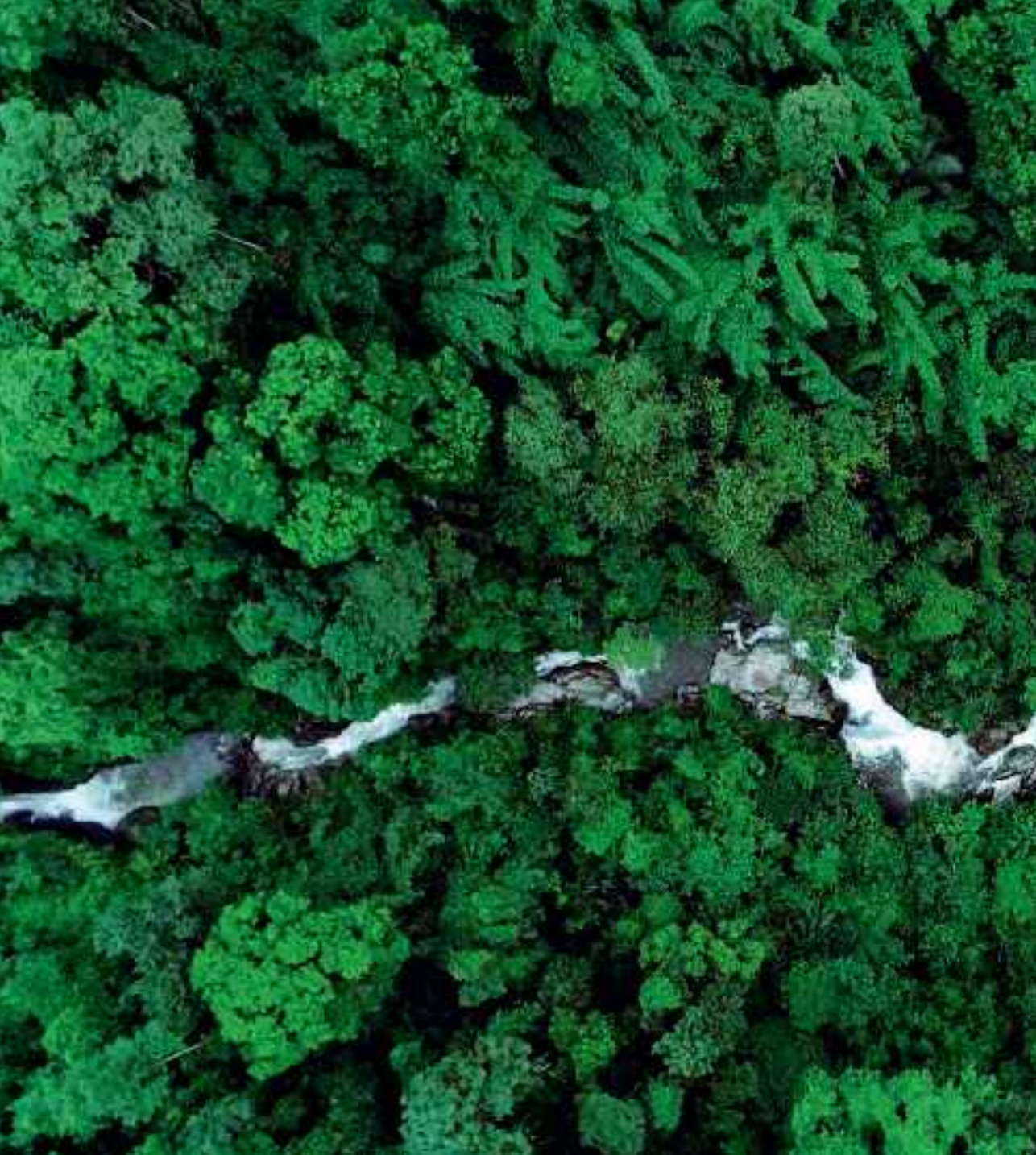
云南铜壁关自然保护区

其实，这些令人心醉的香气，都是植物通过消耗自身能量产生的，原本是生存所迫，并不是为了满足人类的口腹之欲。我的一部分在中国云南的铜壁关自然保护区，地球上纬度最高的热带雨林之一，优渥的温度和湿度让众多生物得以共同生存，但也常常短兵相接。人类所谓的“香气”，其实就是植物的武器之一。