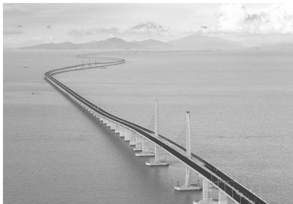
图 0-2 港珠澳大桥

我们沐浴着改革开放的春风，伴随着祖国强盛的步伐成长起来，在和平的环境下，接受了优良教育，享受着幸福的生活。我们不能忘记这样的美好生活是如何得来的，要明白社会主义是干出来的，新时代也是干出来的，明白“空谈误国，实干兴邦”的道理，更要自觉培养自己的实干精神，学习榜样，躬身行动，传承劳动精神。