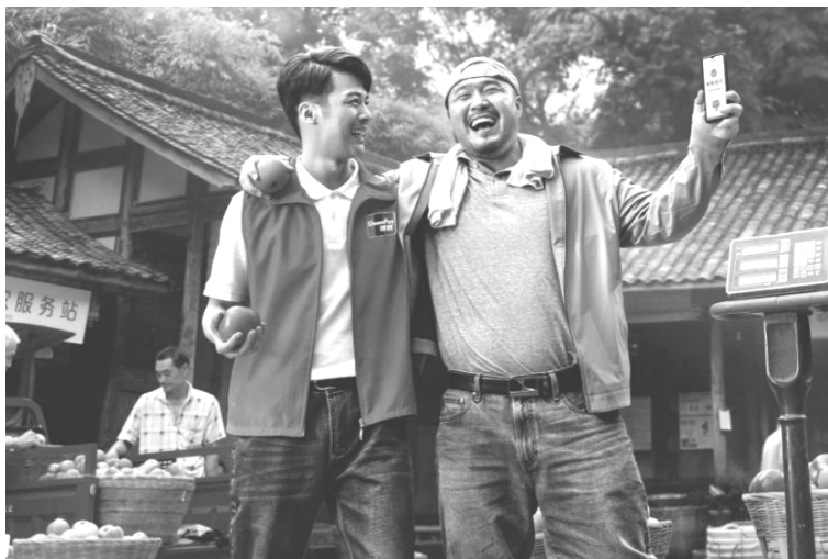
图0-1 在惠农服务站卖货的果农

我们看到,每个付出者因劳动过上了幸福生活,脸上也因体验到的成就感和满足感而洋溢着自信的笑容;我们看到,正是这些默默付出的劳动者,才造就了我们的幸福生活;我们还看到,正是有了每个付出者的努力,点滴汇聚起来才换得了我们国家现在的强大。