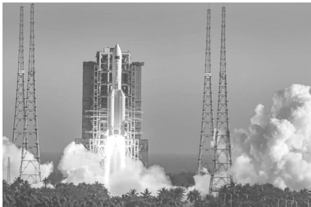
图 0-3 长征五号 B 运载火箭

2020年5月8日13时49分，长征五号B运载火箭（见图0-3）搭载的新一代载人飞船试验船返回舱成功返回。长征五号B运载火箭首次飞行任务的圆满成功，标志着空间站阶段飞行任务首战告捷，为全面实现我国载人航天工程第三步发展战略奠定了坚实基础，意义非常重大。按下长征五号B运载火箭点火按钮的操作员是石家庄小伙尹景波。