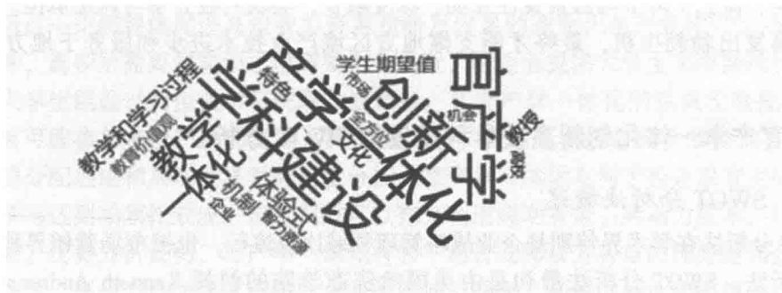
图 1 基于数据挖掘的与学科建设关系密切的因素频次

本研究借助基于数据挖掘的与学科建设关系密切的因素频次,如图 1 所示,该图直观地显示了与学科建设关系最为密切的因素,依次为产学研一体化、官产学、创新、教学一体化。可见,与产学研一体化和官产学这两个因素十分接近的因素与学科建设关系最为密切。基于此,本研究使用“学科建设影响来源——数据挖掘 COSD - Prediger”模型继续验证,深入探究产学研合作与特色重点学科建设的内在逻辑,从 Prediger 六因素中验证官产学是否与学科建设稳健相关。