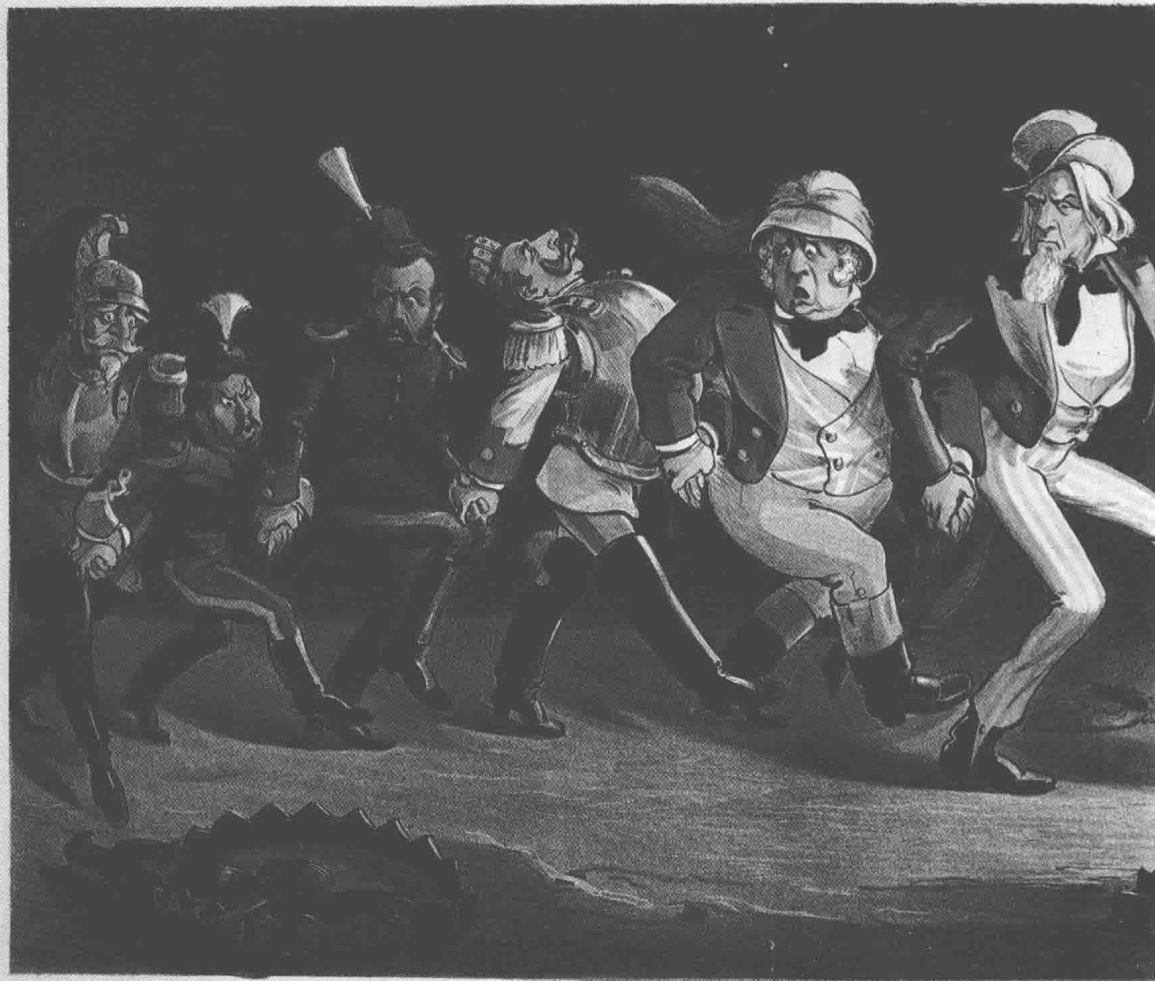
Cartoon, by Alfred R. Wenzel.