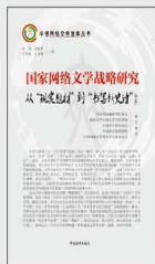
《国家网络文学战略研究：从“现实题材”到“书写新史诗”》