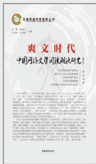
《爽文时代：中国网络文学阅读潮流研究（第1季）》