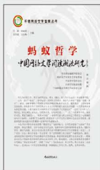
《蚂蚁哲学：中国网络文学阅读潮流研究（第5季）》