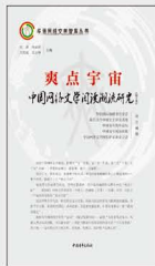
《爽点宇宙：中国网络文学阅读潮流研究（第2季）》