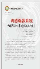
《爽感爆款系统：中国网络文学阅读潮流研究（第3季）》