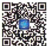
中国传媒大学出版社 二维码