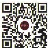
中国传媒大学出版社 微店二维码

《基特勒论媒介》向媒介理论学习者们提供了学习基特勒基本见解的指引。本书的引言部分将基特勒的作品置于德国20世纪的动荡环境（从第二次世界大战、20世纪60年代晚期的文化动荡到德国的重新统一）中进行探讨。随后，本书简明扼要地总结了基特勒受法国后结构主义启发所做的话语分析研究，与媒介有关的理论建构工作，还有他最晚近关于文化技术和古希腊计数系统的作品。相信对这样一个富有魅力的学者的清晰而迷人的概述会受到媒介、传播和文化研究领域的学生和学者们的喜爱。